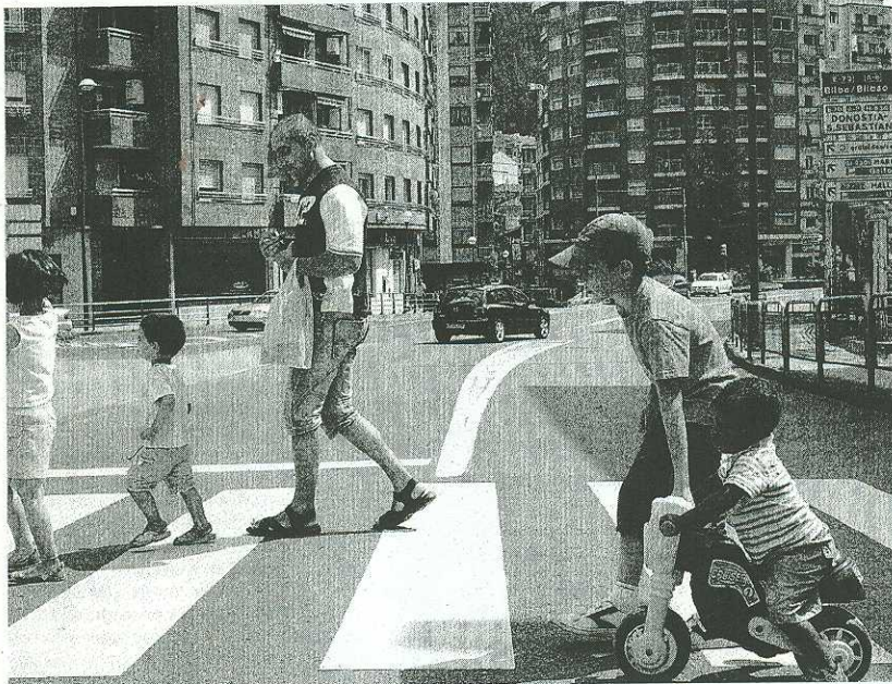
El Consejo opinará sobre la configuración urbanística de Ermua.

Ya en la anterior redacción del Plan General de Ordenación Urbana del municipio se incluyó la participación de asociaciones, aunque la de 2008 lo establece por ley «algo con lo que estoy completamente de acuerdo, porque enriquece el debate de los grandes hi-