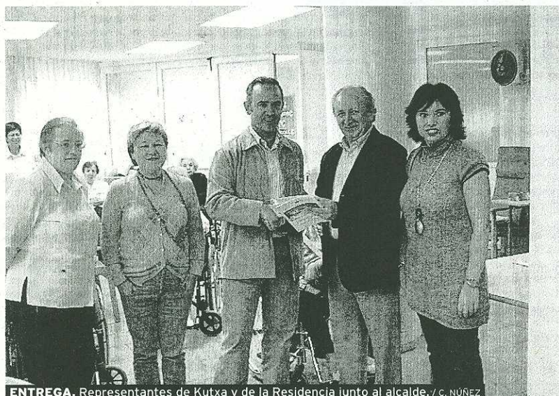
ENTREGA. Representantes de Kutxa y de la Residencia junto al alcalde.

El Euskaltegi Kaltxango AEK de Ermua cuenta con plazas en todos los niveles con amplia oferta horaria, con posibilidad de aprender a turnos. Este próximo lunes comenzará un curso de iniciación de 16.30 a 18.30 horas. Además, durante este curso, tendrán la posibilidad de recibir clases de EGA de primero, segundo y tercero que se compatibilizan con los perfiles lingüísticos. Hay posibilidad de conseguir becas municipales y del Gobierno vasco. El vecindario de Mallabia dispone de matrícula gratuita.