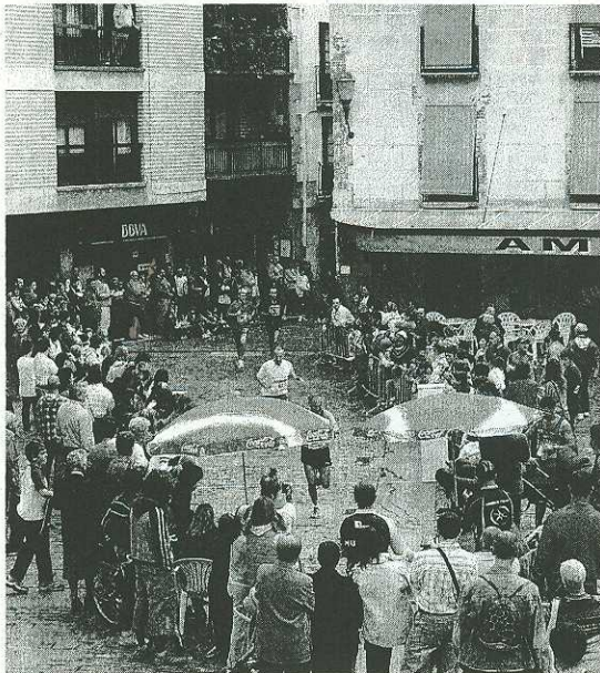
El cross popular congrega a cientos de aficionados.

A las 11.30 de la mañana se pondrá en marcha la prueba absoluta en la que se cubrirá una distancia de 11.250 metros, si bien ayer a última hora se iba a proceder a medir correctamente el tramo. Se saldrá desde la plaza Txurruka y se irá hasta Deba por la carretera GI-638, se pasará por el viejo puente y tras superar el puerto acudirán hasta la altura del Casino para volver por la Alameda,