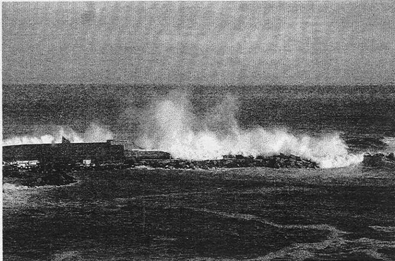
Impacto de las olas y la monumental altura que alcanzan doblando incluso al Muelle de Abrigo...