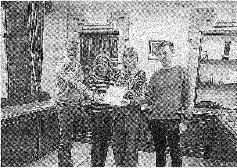
Se prevé una subida del 5,11% en el presupuesto.

Gámiz destacó que no se trata de un presupuesto improvisado, sino del resultado de una gestión “responsable, previsor y profundamente comprometida con el bienestar colectivo”. Añadió que el proyecto refuerza dos pilares esenciales de la acción de gobierno: unos servicios públicos sólidos y de calidad y medidas que favorezcan el empleo, además de mantener “una apuesta muy nuestra, la cultura”, a la que definió