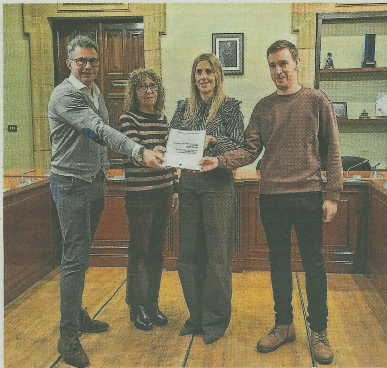
La alcaldesa y ediles del equipo de gobierno muestran el documento. A. L.

En cuanto a las partidas, más de 9,7 millones de euros se destinan a personal municipal, invirtiendo en los trabajadores públicos que garantizan el funcionamiento de los servicios esenciales. A esto se suman más de 9,3 millones en bienes y servicios, permitiendo el mantenimiento de la ciudad y el apoyo a