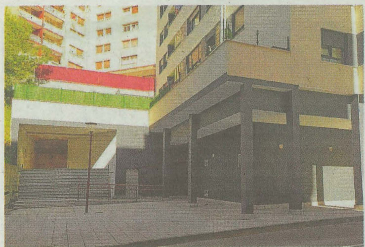
En la foto se puede ver el espacio en el que irá encajado el ascensor. E. C.

Melchor, Gaspar y Baltasar irán precedidos también por la Policía Municipal. Detrás, los acompañará la Cruz Roja, además de los agentes de la Policía local que cerrarán el desfile.