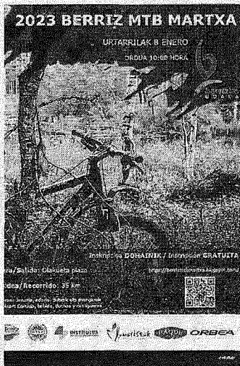
Cartel de la marcha.

Con un desnivel acumulado de 1150 metros y una altura máxima de 860 metros, este año no habrá dos circuitos, corto y largo, pero se permitirá atajar. En este sentido, hasta cruzar la forestal habrá tres opciones de reducir las distancias que indicarán los voluntarios. “Creemos que nos ha salido un recorrido bonito y esperamos disfrutarlo. Si no llueve mucho las pis-