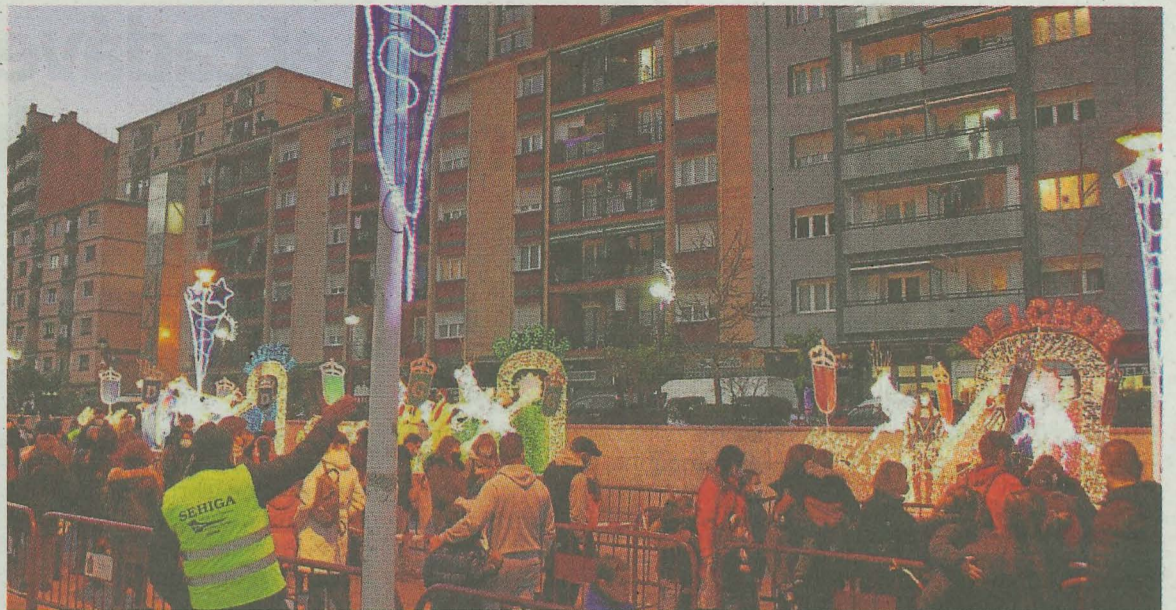
Los últimos años el desfile ha terminado en la plaza San Pelayo y no se podía charlar con los Reyes Magos. A.L.

Esta partida presupuestaria se sumará a la ya establecida en el anterior concurso que resultó desierto. En total, se destinarán 257.000 euros a esta nueva licitación.