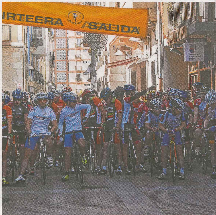
El año pasado el Premio Deba contó con buena participación.

El Premio Deba llevará a los cadetes por la carretera desde el municipio hasta Bergara, y desde ahí se regresará para terminar en la recta