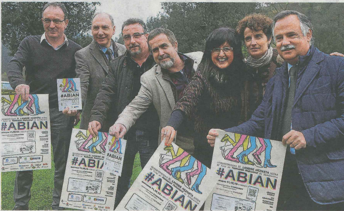
Responsables de los centros de FP de la comarca y cargos públicos presentaron la feria.