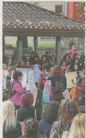
Planto feminista en 2019. A. L.

El cuentacuentos comenzará a las 17.30 horas en Lobiano. La entrada es gratuita, pero será necesario reservar plaza con antelación en la biblioteca, llamando al teléfono 943 179 212.