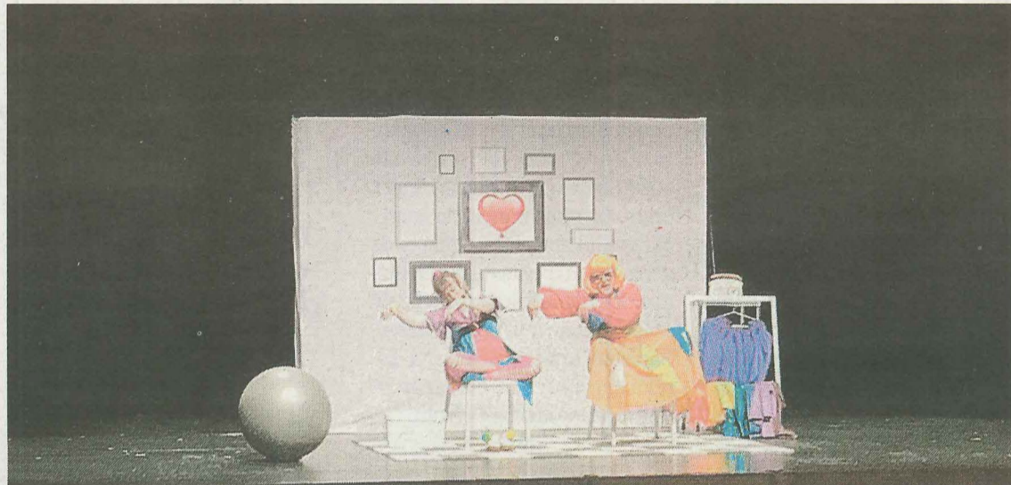
Meri, Mari eta Lari antzerkia, Igorreko Lasarte aretoan, otsailaren 27an. LASARTE ARETOA