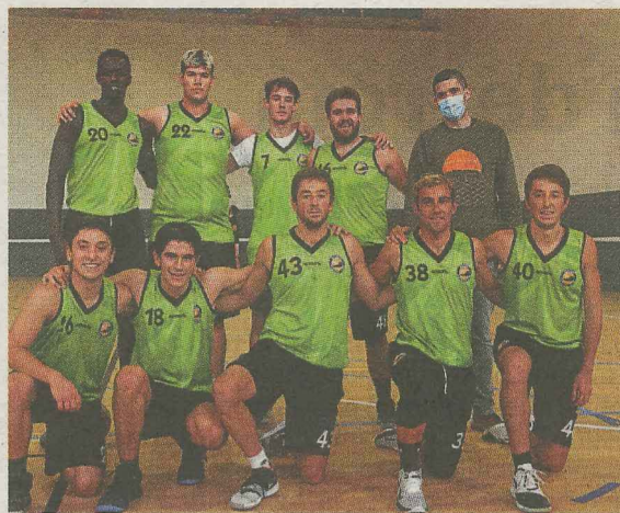
Zalburdi Debasket lehiaketarekin jarraituko du datorren astean. Perosanz Debasket ez du lehiatuko baina jokalarri batzuk hirugarren mailan ariduko dira. SALEGI