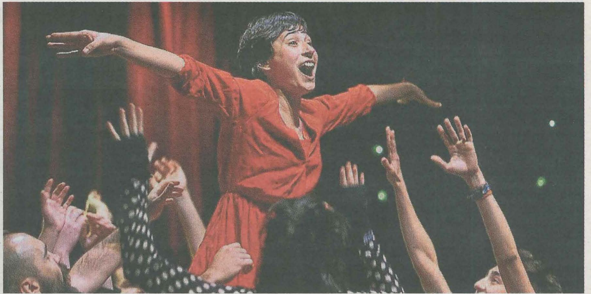
La obra '¿Qué fue de Ana García?' habla sobre las violencias que se generan contra lo diferente. E. C.

El próximo lunes, Día Internacional de la Mujer, esta plataforma ha programado una manifestación, dirigida a toda la población, bajo el lema 'Gora borroka feminista, antikapitalista eta antiarrazista', a partir de las 19.00 horas, que partirá de la plaza Cardenal Orbe.