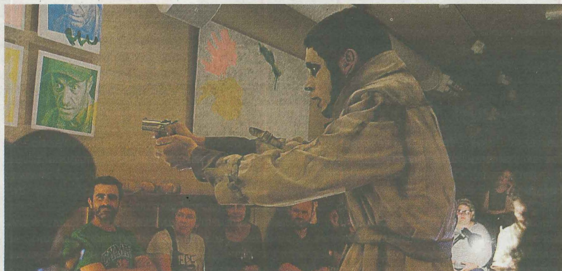
Bilboko Erronda kaleko Bira kulturgunean egindako antzerki bat, pandemia baino lehen.

Hondamendia da guretzat; ez dugu amore emango, baina ez dakigu zenbat iraun ahalko dugun»