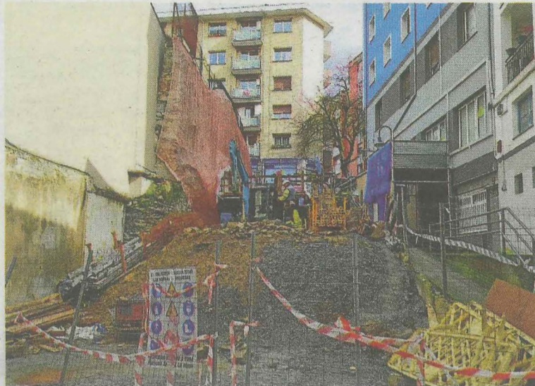
En este espacio se creará un acceso a la plaza y la réplica del caserío. A.L.

La obra de derribo y la rehabilitación parcial del caserío Aldapakua se está ejecutando por la vía de urgencia tras modificarse la previsión y el proyecto inicial para adaptarlo a la situación real, una vez constatados varios problemas y el deficiente estado de los muros tanto de carga como de estructura. No en vano el edi-