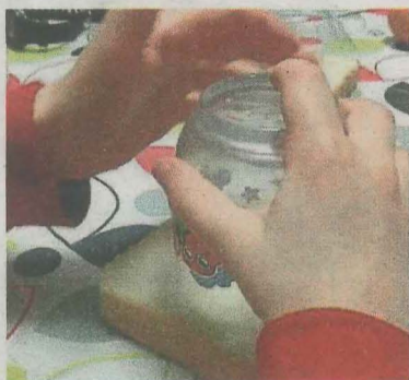
Tiempo para cocinar.

De esa forma, se divierten pintando, al desarrollar la motricidad fina, con juegos de mesa, concursos de repostería y cocina, talleres para confeccionar centros de mesa, fiestas de disfraces y un cuento viajero en el que cada niño y niña tiene que