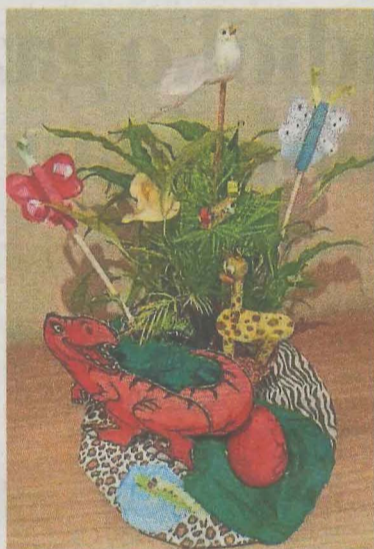
Taller de manualidades.

relatar una pequeña historia con un dibujo y un texto, y poco a poco ir completándolo entre todos.