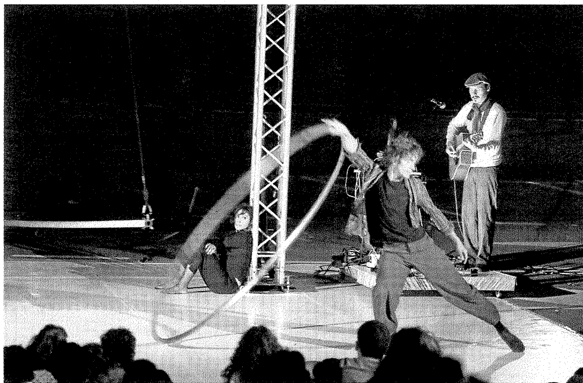
Representación del montaje 'Atempo Circ', que llegará a Ermua el día 26 por la noche. ■ E. C.

El 'Día del Niño y la Niña', 21 de julio, los más pequeños podrán dis-