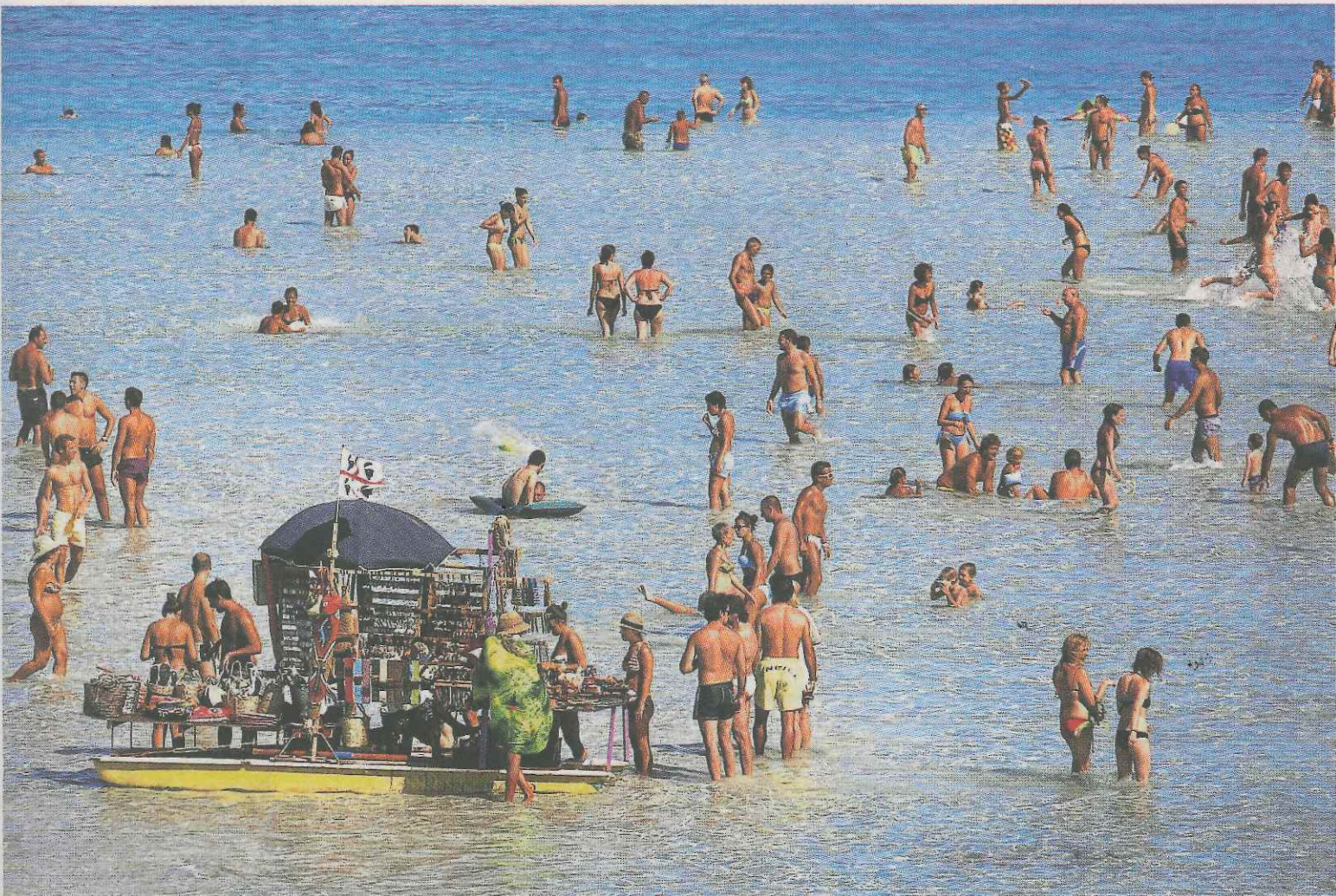
Vista de una playa de Cerdeña, un destino por el que ha subido el interés este año según las agencias ermuarras consultadas.