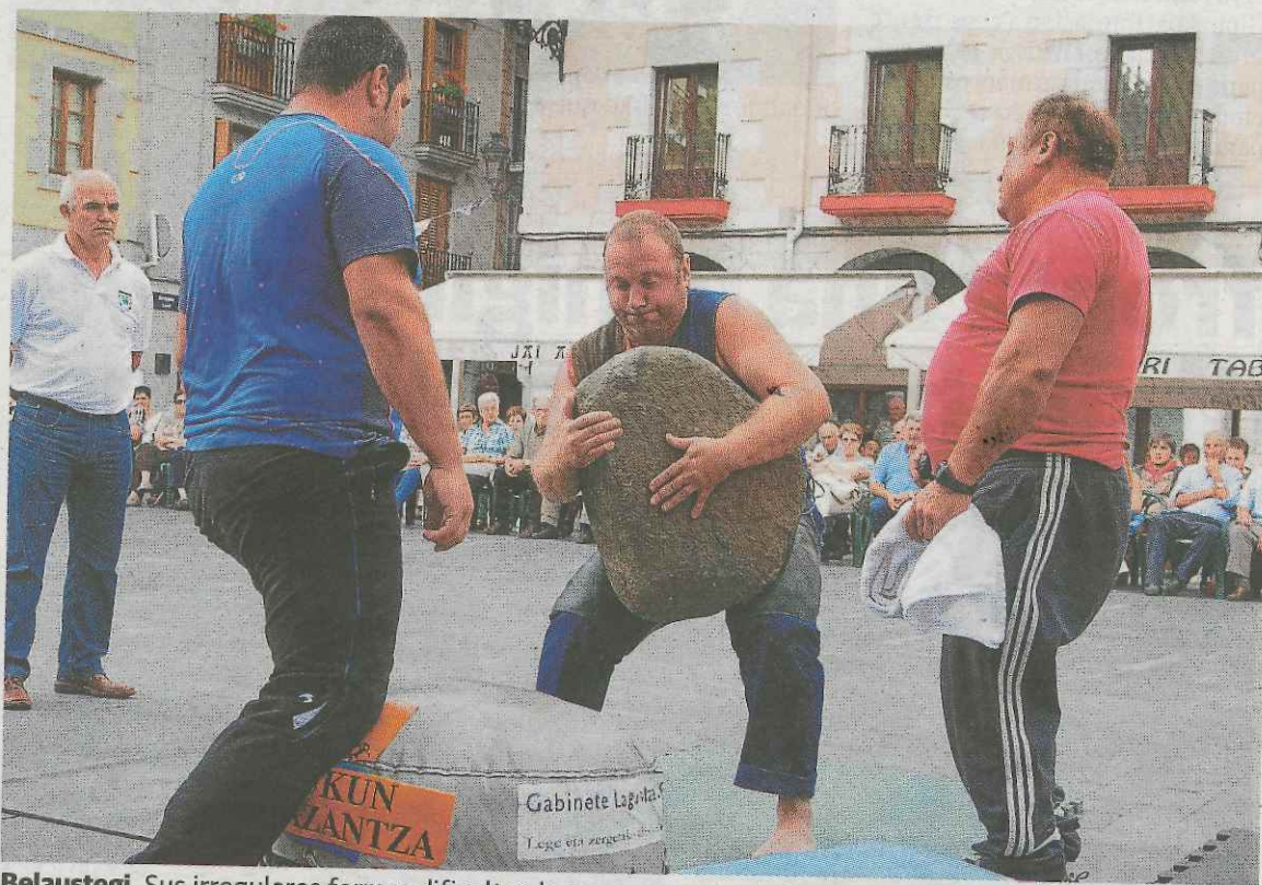
Belaustegi. Sus irregulares formas dificultan la tarea con esta piedra, que pesa 146 kilos. ✱ AITOR

El encuentro del día 29, viene precedido del mal sabor de boca que dejó a organizadores y público la edición del año pasado, no tanto por el esfuerzo desplegado por los levantadores que acudieron a Elgoibar como por la escasa participación, con tan solo tres harrijasotzailles inscritos. Entre las diferentes causas para tan bajo número de levantadores en liza hay una que cobra fuerza sobre las demás, y es la derivada de las dificultades que tienen los levantadores a la hora de medirse con la piedra de Belaustegi, tal y como