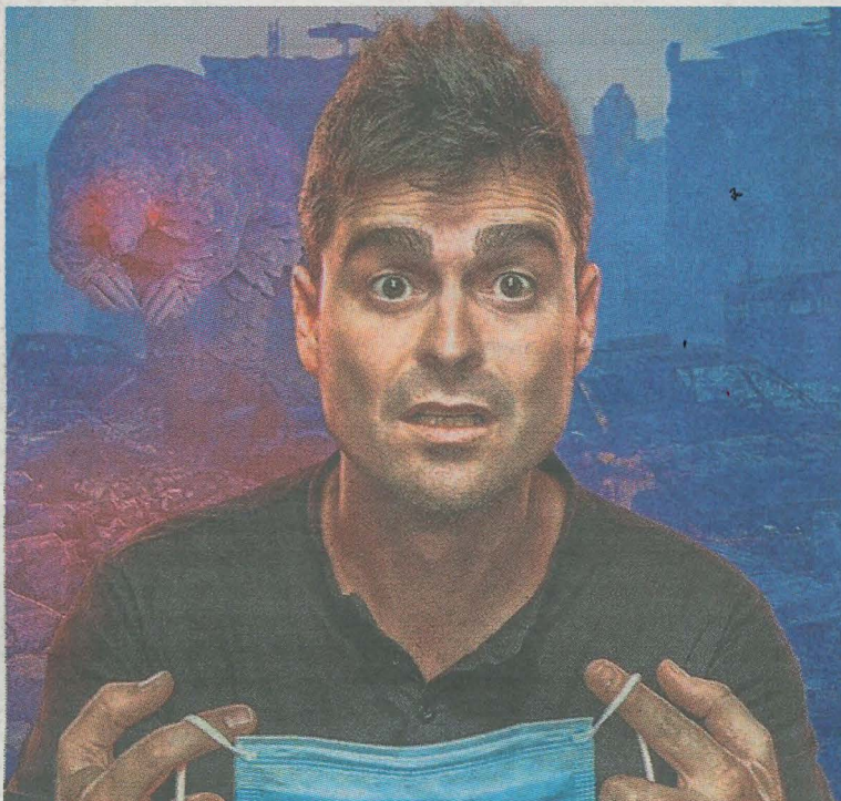
Clavero hablará en clave de humor e ironía de la post-pandemia. E.N

Este encuentro, con el lema 'Colaborar juntos para formar', está dirigido a familias y entrenadores. Contará con plazas li-