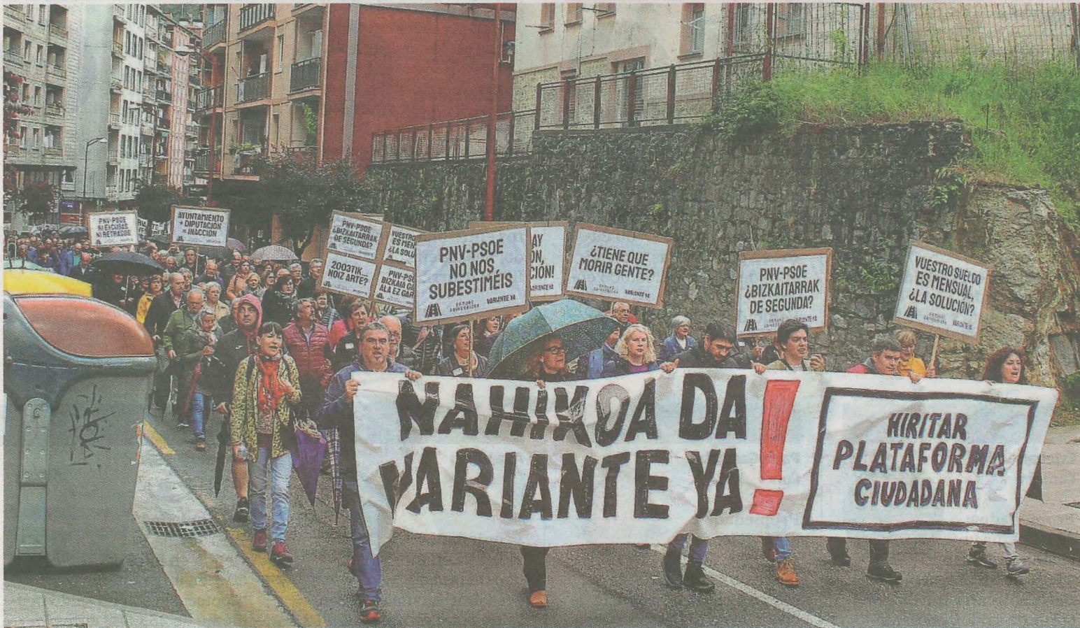
Una de las últimas manifestaciones para reclamar la ejecución de la variante, celebrada el pasado mes de mayo.