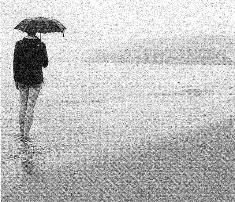
Una imagen de la playa de Ereaga, el pasado agosto.

La Diputación Foral de Bizkaia, encargada de la gestión de las playas del territorio, realizó ayer el balance de la temporada que finalizó el pasado sábado. Han sido unos meses marcados "especialmente" por las condiciones meteorológicas, según subrayó la diputada foral de Medio Natural y Agricultura, Arantza