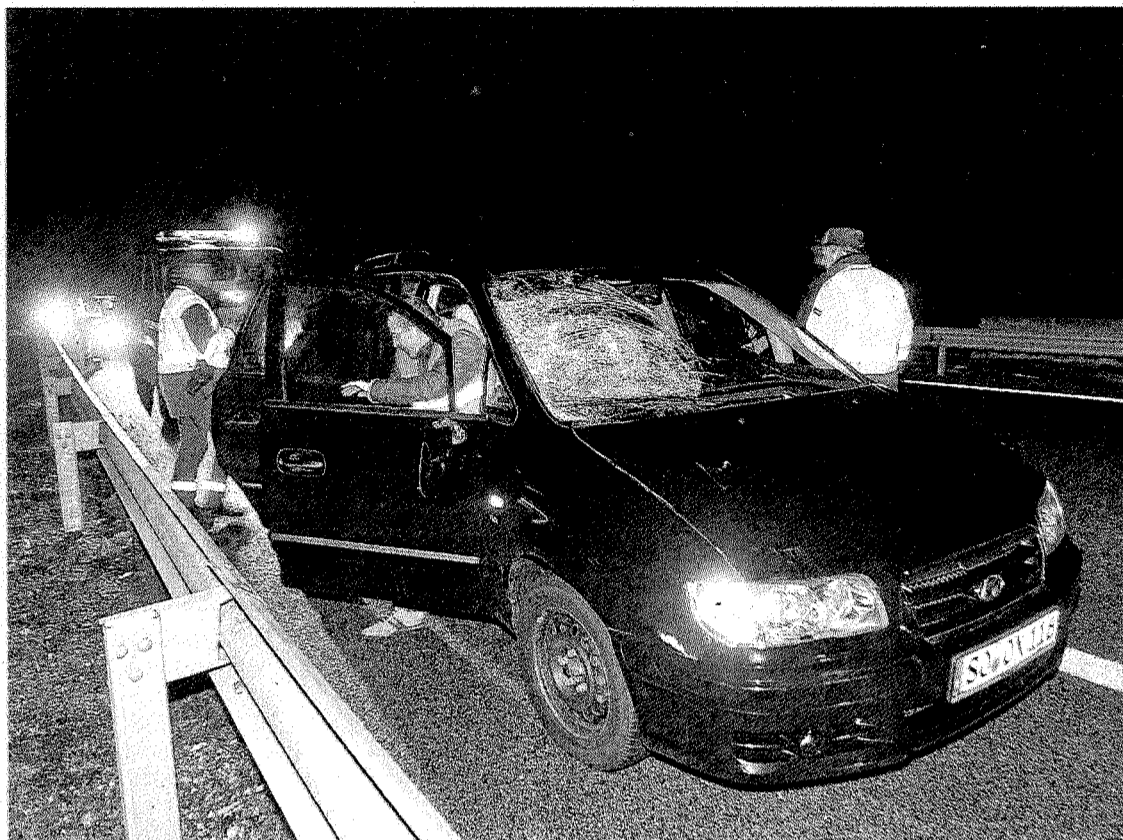
La víctima fue atropellada por un coche matriculado en Alemania.

El último episodio de maltrato se registró en Ermua durante la tarde del sábado. Una mujer solicitó la presencia de la Ertzaintza tras discutir con su expareja, con la que comparte piso. Al parecer, el hombre, de 52 años, entró en la habitación de la víctima, donde también estaba una hija de ambos de corta edad, la insultó y la zarandeó. Una patrulla policial comprobó que la afectada presentaba un hematoma en la cara por lo que detuvieron al varón.