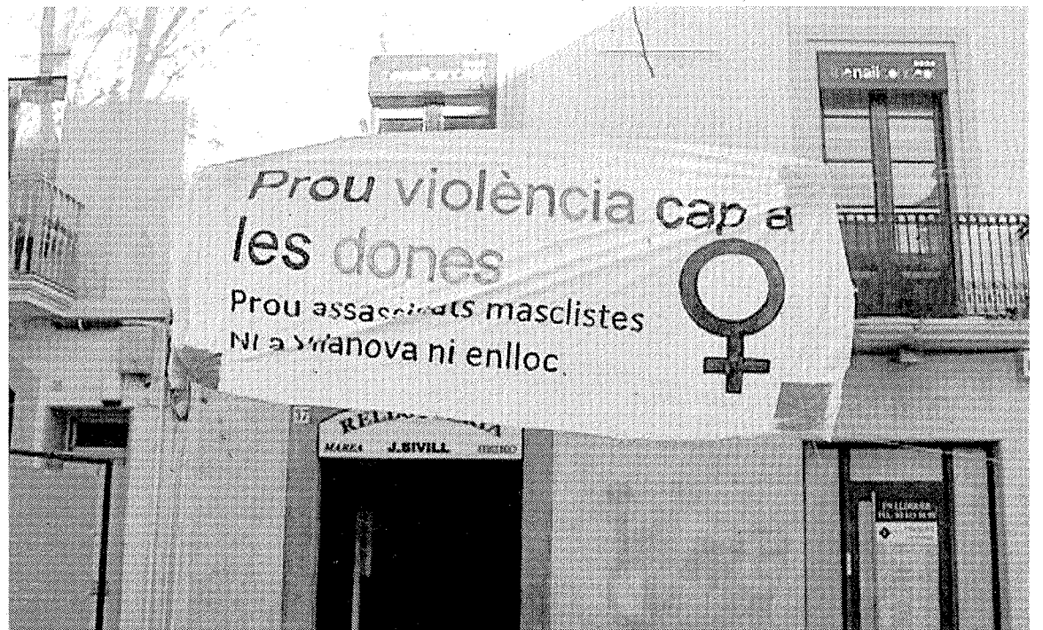
Cartel colocado ayer en la rambla de Vilanova i la Geltrú, Barcelona.

Este asesinato ocurrido en Vilanova i la Geltrú es el primero de este año clasificado como violencia machista