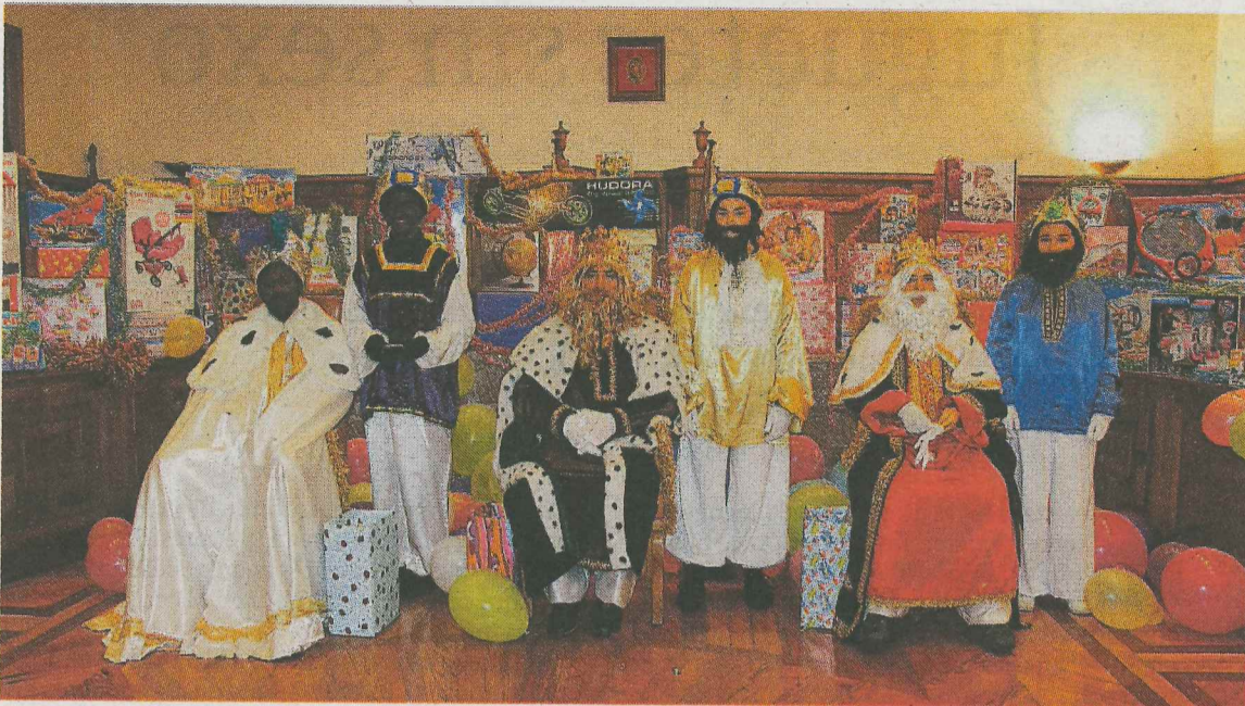
Los Reyes Magos, con sus pajes, esperaron con sus regalos a los niños debarra.