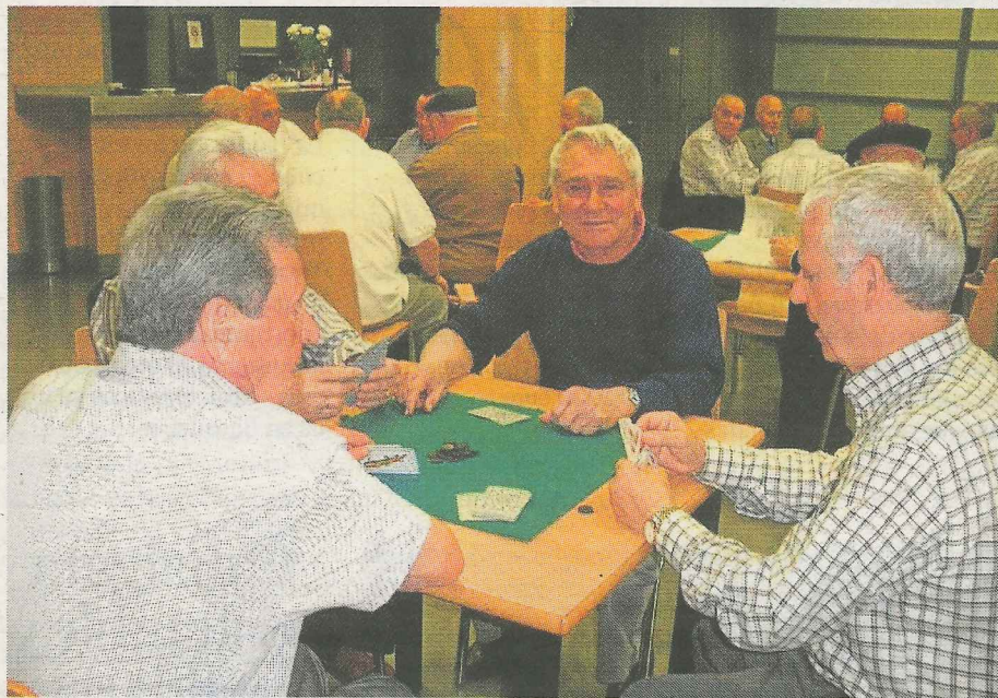
El envejecimiento poblacional hace necesario crear este tipo de cursos.

Por último, el cursillo de relajación comenzará el próximo día 27 y se desarrollará hasta el 16 de junio. Este taller tendrá una duración de 29 horas y se impartirá todos los martes de 10.00 a 11.30 horas en el local municipal de voluntariado. De esta manera, Getxo busca cuidar al cuidador para beneficio de las personas dependientes del municipio. ●