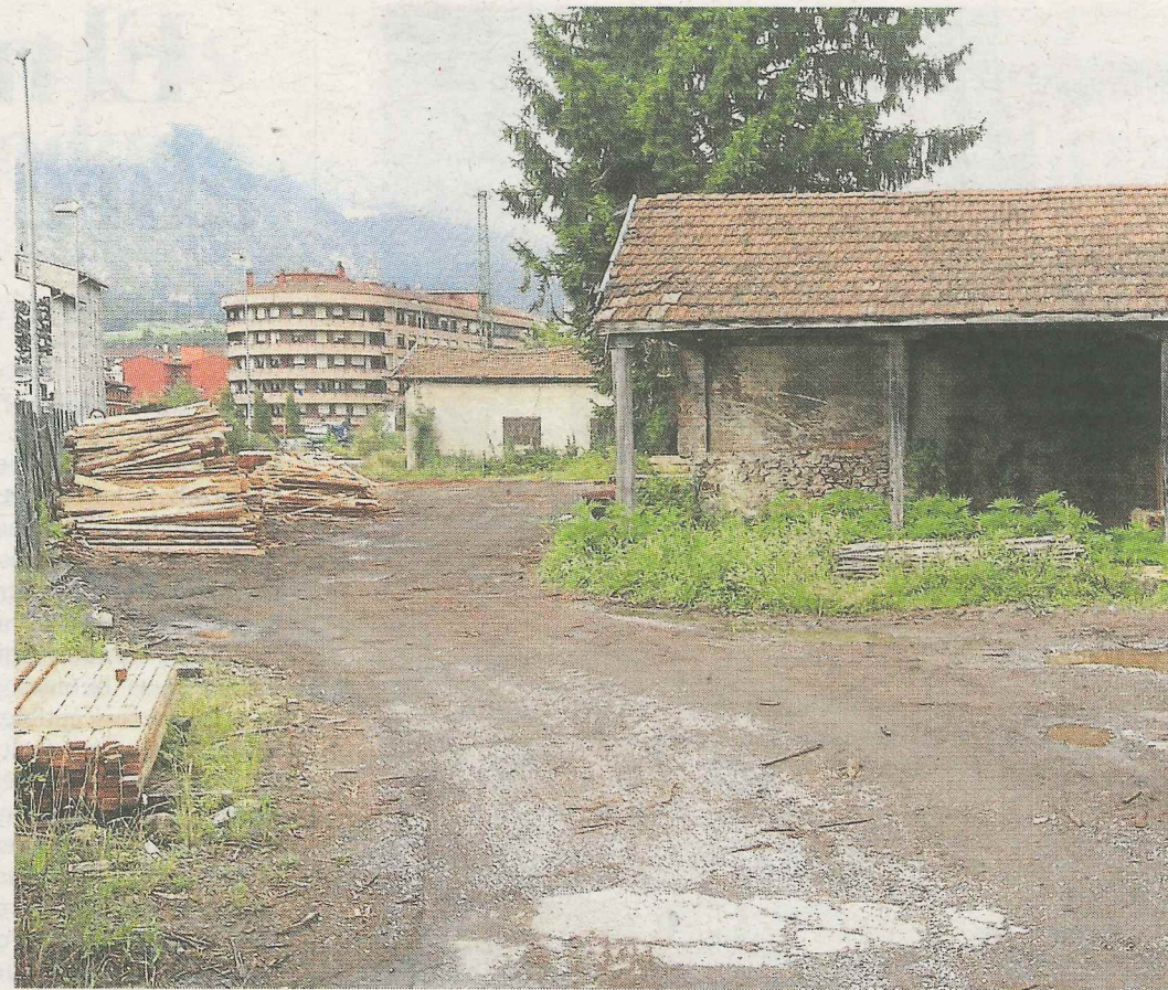
La serrería iurretarra desaparecerá del centro urbano del municipio.