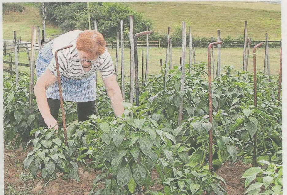
Los huertos urbanos se están expandiendo también por Markina.