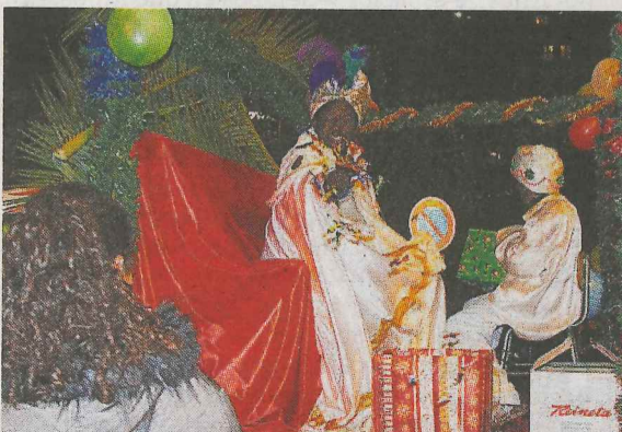
Las carrozas destacaron en la jornada de ayer.

ron su aparición ayer como el último de los actos de las navidades. Los Tres Reyes Magos lucieron sus elegantes atuendos por las calles de Deba y vinieron acompañados por sus pajes. Muchos debarra se acercaron a presenciar la Cabalgata y a estar con Sus Majestades de Oriente. Durante su recorrido no pararon de saludar y a dirigir sonrisas a todos los presentes.