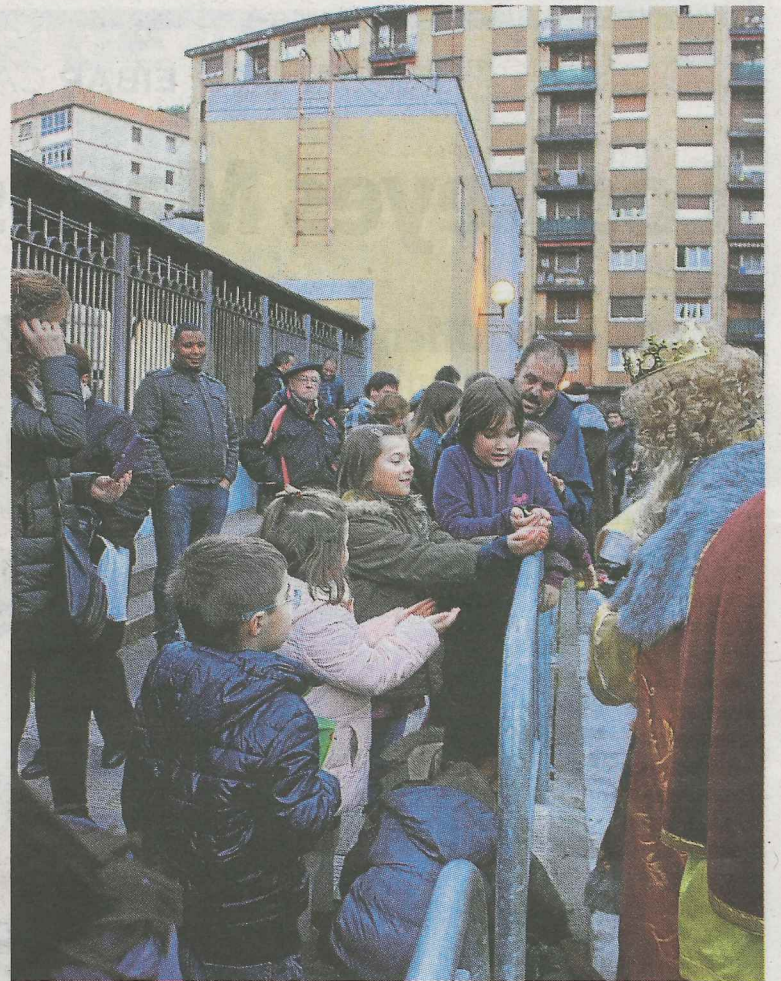
Sus majestades repartieron caramelos a pie de calle.