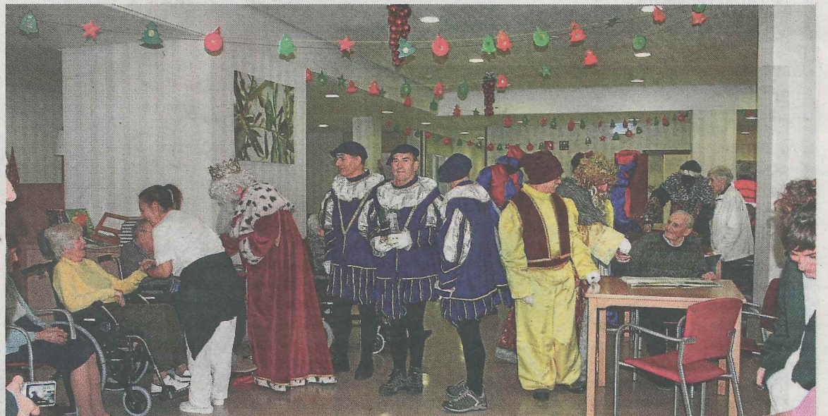
Los Reyes Magos tuvieron tiempo de visitar la residencia de Ermua.

del colegio San Lorenzo, desde donde habitualmente da comienzo el pasacalles, pero no había un hueco en todo el recorrido. Junto con la txaranga Irulitxa, la Policía Municipal y la Cruz Roja, las nuevas carrozas de los Reyes de Oriente marcaron de nuevo el recorrido sin ningún percance destacable y con el beneplácito de los infantes ermuarras, que después del paseo pudieron hablar personalmente con los Reyes en el quiosco de la plaza.