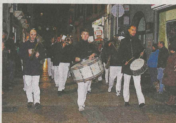
La música no faltó en la cabalgata de Reyes.