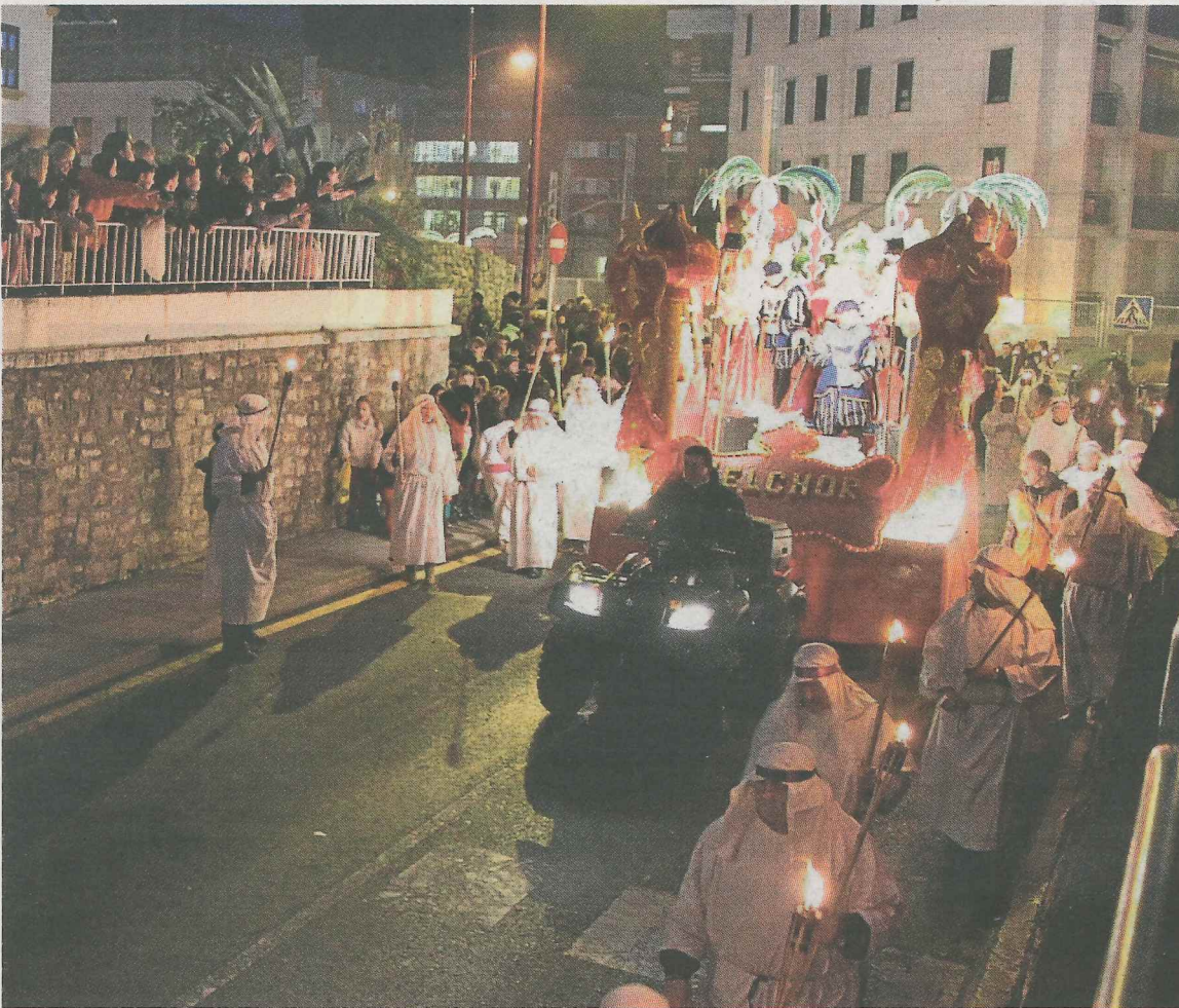
La comitiva real recorrió las calles centrales del municipio.