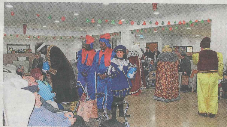
Sus majestados visitaron la residencia de ancianos.

* EL CORREO no se hace responsable de cambios de última hora