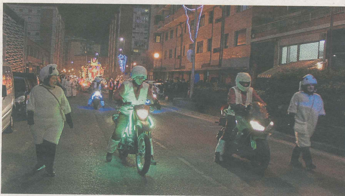
Los moteros fueron la novedad en la comitiva real de este año.