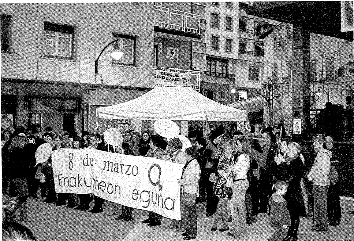
La concentración anual volverá a celebrarse este sábado en la plaza. ■ AINHOA LASUEN

En el escrito que se colocará en todos los portales de Ermua, el Consejo municipal de Igualdad del municipio hará saber a la población de la villa, que declara que «las organizaciones feministas y pro-igualitarias deben estar presentes y ser reconocidas como interlocutoras clave en el impulso de las políticas locales de igualdad» y llaman a toda la ciudadanía, en especial a las mujeres, «para que tengan una posición activa en la reivindicación y defensa de los derechos que tanto