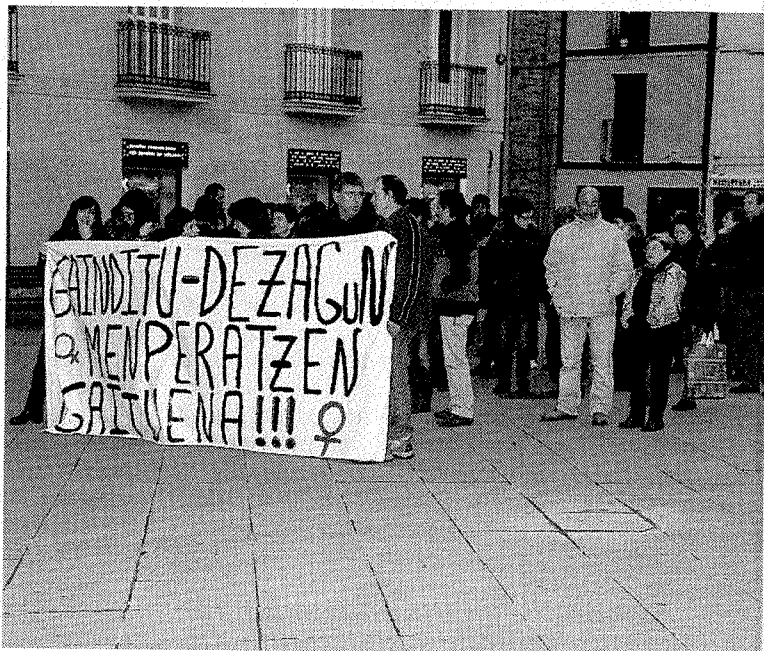
Una de las concentraciones del Día Internacional de la Mujer.

Once pintoras debarras presentarán en el municipio una muestra de sus obras. Con motivo del Día Internacional de la Mujer se podrá ver la exposición 'Cuando trataron de callarme, grité'. En su elaboración han participado las artistas M a Jo-