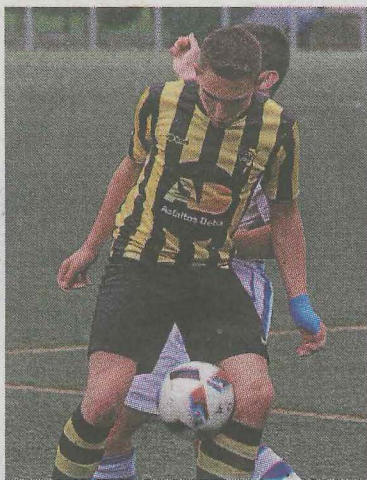
Torronteras anotó un gol.

El equipo juvenil recibió un duro castigo en Bergara. Los debarra jugaron un buen partido y volvieron a casa con las manos vacías. Estaba siendo superior el equipo entrenado por Hidalgo y Badiola, pero en la segunda mitad, en una salida de balón se produjo un fallo defensivo y llegó el único gol del encuentro. Los debarra tuvieron oportunidades de establecer el empate, pero al final el marcador