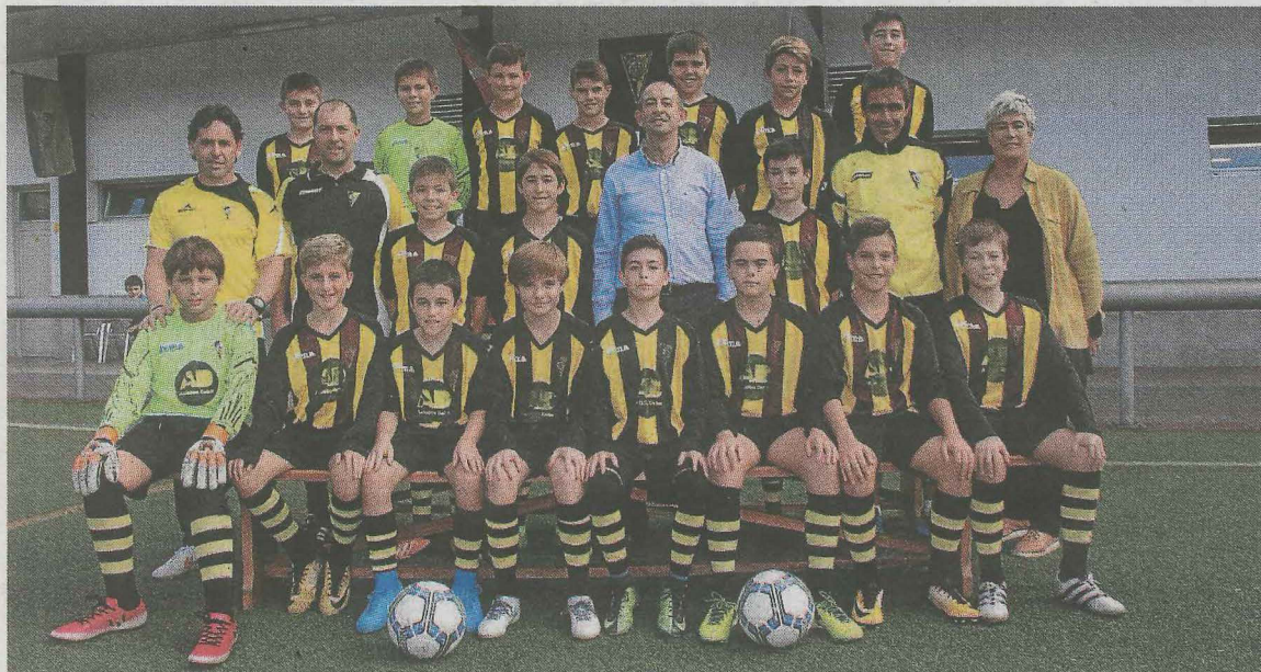
El Infantil txiki ha conseguido tres victorias en las tres jornadas que ha disputado.