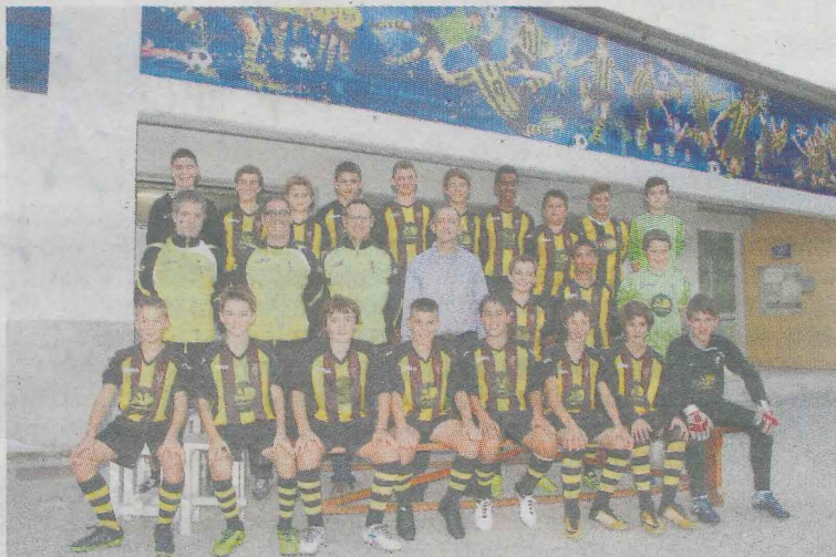
El infantil masculino jugará el torneo Aldamar.

El domingo por la mañana disputaron un partido de consolación contra el Terrasa, comenzaron perdiendo