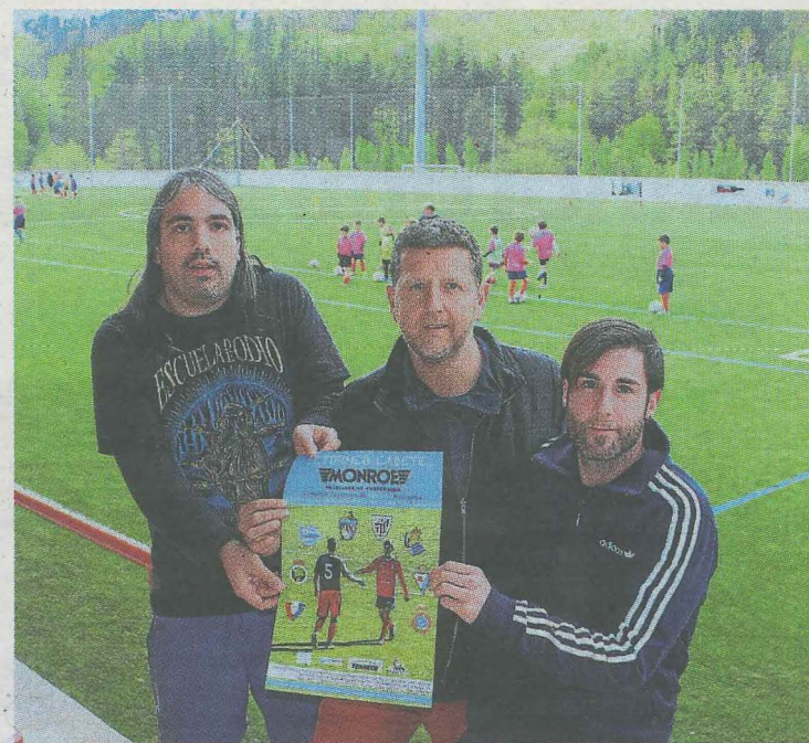
Los organizadores, en la presentación del pasado año.

El nuevo disco está formado por nuevas canciones y viejos éxitos de la banda, surgida hace 4 años, porque consideran que su primer trabajo no ha llegado a todo el público que ellos deseaban por lo que optan por una recopilación de nuevos temas y algunos de sus temas más icónicos. La difusión de su trabajo es el objetivo principal del grupo, del que se puede disfrutar en todas las plataformas on line.