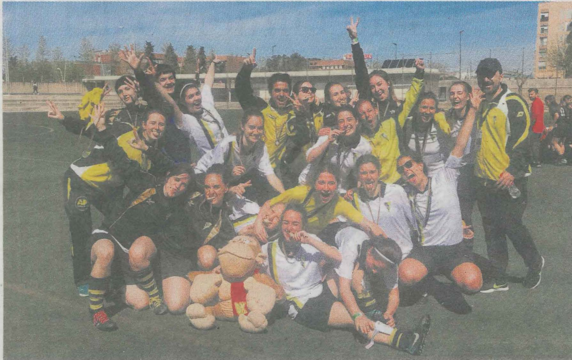
Las chicas del regional posan con las medallas logradas en el torneo de Salou.