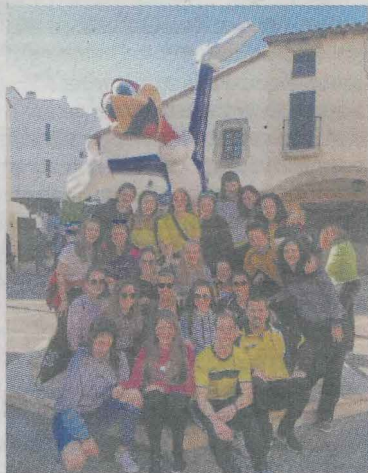
Las del regional, en Port Aventura.

do las debarras, pero rápidamente Aguirre logró poner las tablas en el marcador. El partido se tuvo que decidir desde los once metros. La tanda de penaltis fue favorable para las debarras que ganaron 4-3. Hubo dos lanzamientos errados por ambas partes. No fue solo deporte, ya que tam-