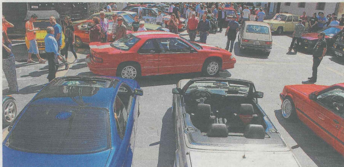
Muestra de coches clásicos organizada por el Centro de Castilla León en la edición anterior.

Esta actividad deportiva se comenzó a generar con la entrada de la nueva directiva del club ermuarra. El objetivo del torneo cadete es el de dotar de un atractivo deportivo al club, que se encuentra en crecimiento, además de que la población ermuarra pueda disfrutar durante la jornada de mañana de un fútbol de calidad en los campos de Betiondo.