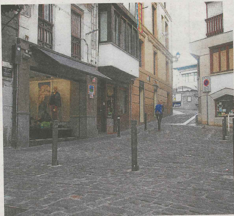
Los pivotes instalados junto a la oficina de Correos. GORRITIBEREA

Los automóviles que hayan accedido por la mañana a la zona y estén aparcados serán sancionados a partir de esa hora, por lo que es vital el que se conozca la orden para que no haya 'sorpresas'. Los propietarios de un negocio o un garaje en la zona cercada, podrán hacerse con la llave de los pivotes acudiendo a las oficinas de la Policía Municipal, y en caso de que se dé una situación de urgencia, se deberá de llamar a la