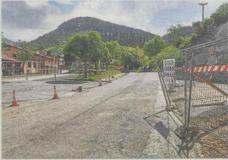
Obras que ETS lleva a cabo en Eitzaga.