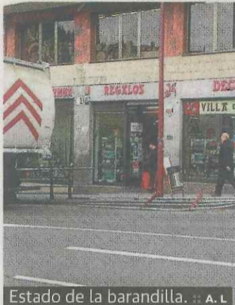
Estado de la barandilla.

La iniciativa de uso del euskerá en Ermua, Berbalagun, ha organizado un taller de pinchos, para el próximo martes. Se llevará a cabo en Eskilarapeko, a partir de las 19 horas. La inscripción costará 5 euros. Las personas que deseen inscribirse en esta actividad en euskera podrán hacerlo llamando al teléfono 663070492 o escribiendo al correo electrónico "ermua_berba@eak.eus".