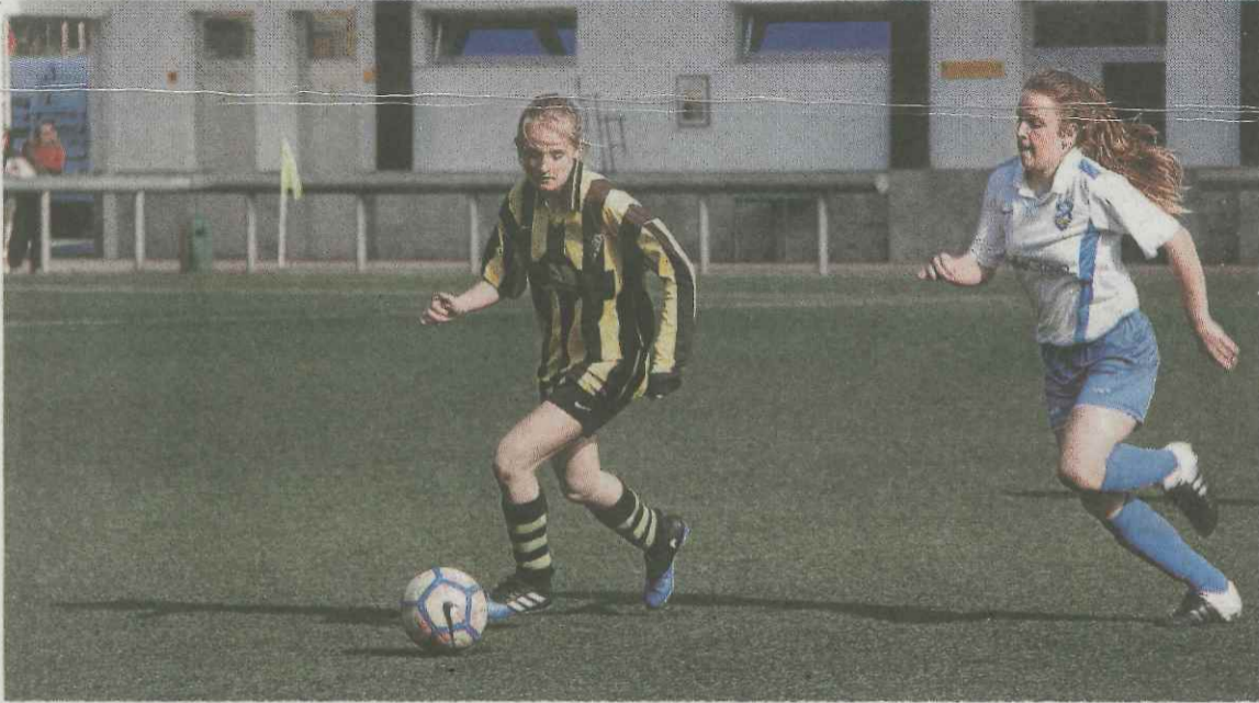
El regional femenino se despide hoy de la temporada, en Errota Zar, frente al Orioko.