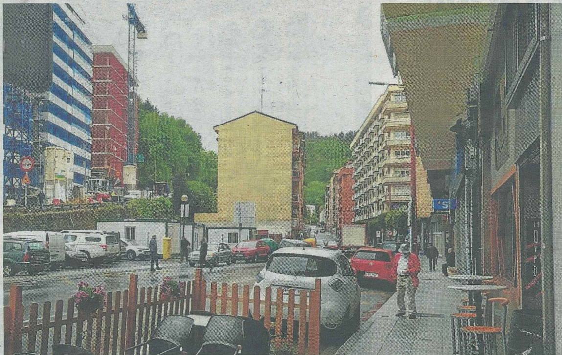
Esta acera y calzada, tanto hacia Mallabia como hacia la Caja Laboral se verán afectadas por las obras. A. LASUEN

La obra de Iberdrola afectará a la zona que va desde Kaltxango (Caja Laboral), pasando por la calle Diputación y siguiendo por delante de la plaza del mercado hasta llegar a la zona de Indartu. También se realizarán obras partiendo desde Kaltxango en la dirección contraria, subiendo por Zeharkalea, llegando a la trase-