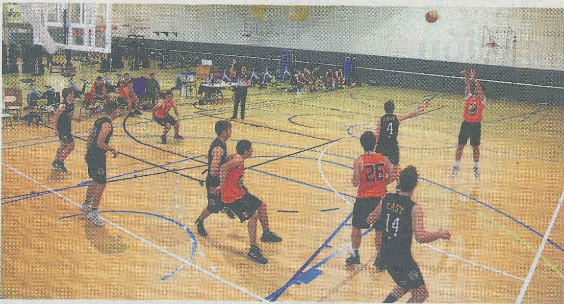
Deba Zalburdi Debasket ha realizado una muy buena primera fase.