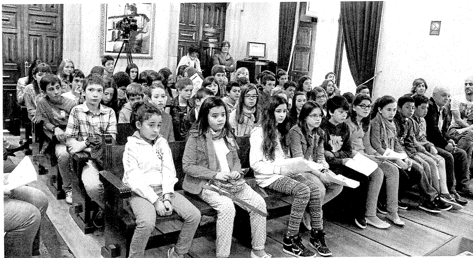
El alumnado de los diferentes centros educativos acudió al pleno con sus propuestas para la corporación municipal.