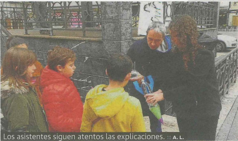
Los asistentes siguen atentos las explicaciones. :: A. L.

Tecnología), para el impulso de las vocaciones científicas y tecnológicas. El proyecto pretende acercar, a los jóvenes y a la ciudadanía en general, a la ciencia, la tecnología, las artes y las matemáticas de una forma más dinámica a través de unos talleres gratuitos en los que se cuenta con profesionales especializados en mostrar sus conocimientos de forma muy atractiva. Aún quedan plazas para inscribirse para los días 26, 27, 28 y 29 de diciembre. Para ello hay que acudir al edificio Torre-