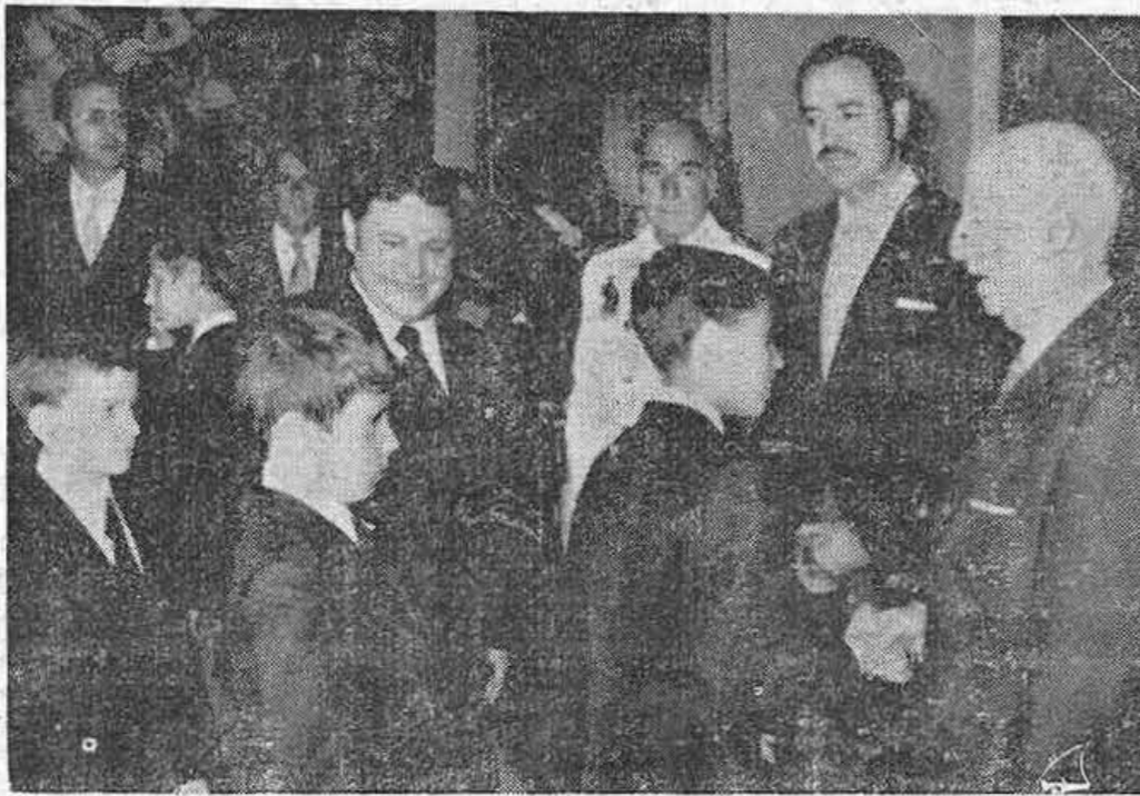
SAN SEBASTIÁN. — Esta mañana han sido recibidos en el Palacio de Ayete, por S.E. el Jefe del Estado, los niños de la Operación «Plus Ultra». En la foto los niños saludan a S.E. el Jefe del Estado. — (Telefoto CIFRA GRAFICA).