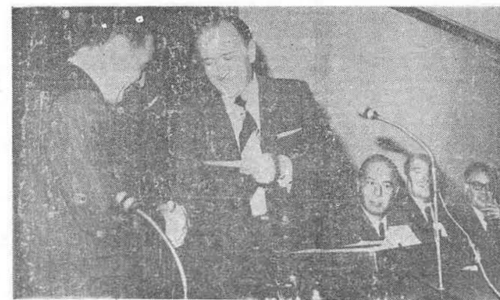
MONDRAGON (Gulpizcoa). — El Ministro de Trabajo, D. Licio de la Fuente, hace entrega al presidente de la Caja Laboral y de Cooperativa Ulgor de un crédito de 75 millones de pesetas que le ha sido concedido con cargo al Fondo Nacional de Protección al Trabajo.