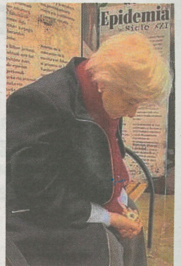
'Mercedes' está en Lobiano. A.L.

'Mercedes' es una escultura hiperrealista, del artista mexicano Rubén Orozco, de una mujer de 89 años que está sola y cabizbaja sentada en un banco.