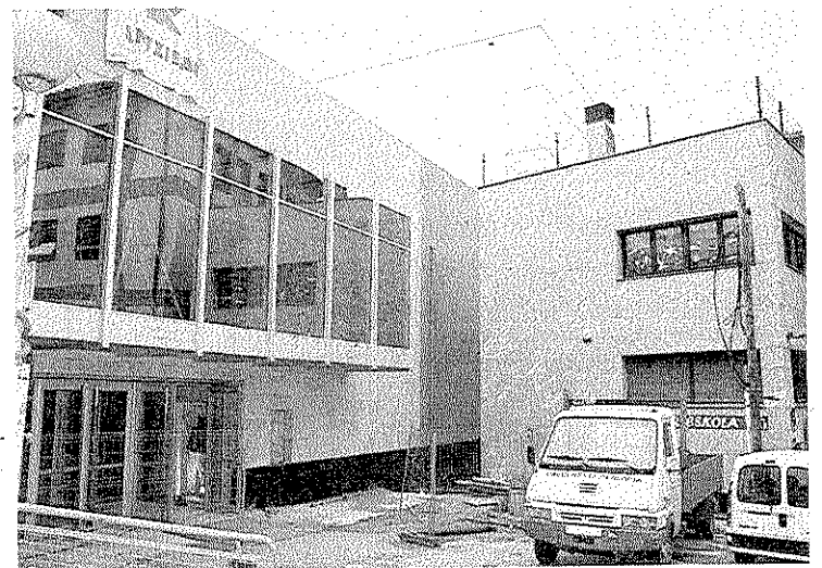
Las obras continúan en el exterior del edificio.

El suelo y las paredes se han adaptado a la necesidad de absorción del sonido, para evitar ecos, a través de ondulaciones en muros, techo o pintura especial y telas acolchadas en toda la sala principal y anfiteatro. En la zona contigua a la sala de butacas (anterior entrada) se encuentran otras salas a las que se dará un uso artístico.