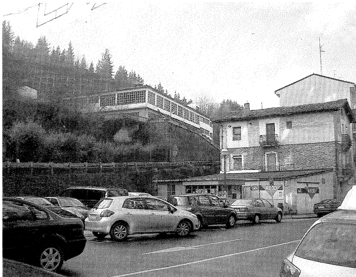
Un paso subterráneo desde este punto, bajo la N-634, dará acceso a la nueva urbanización.