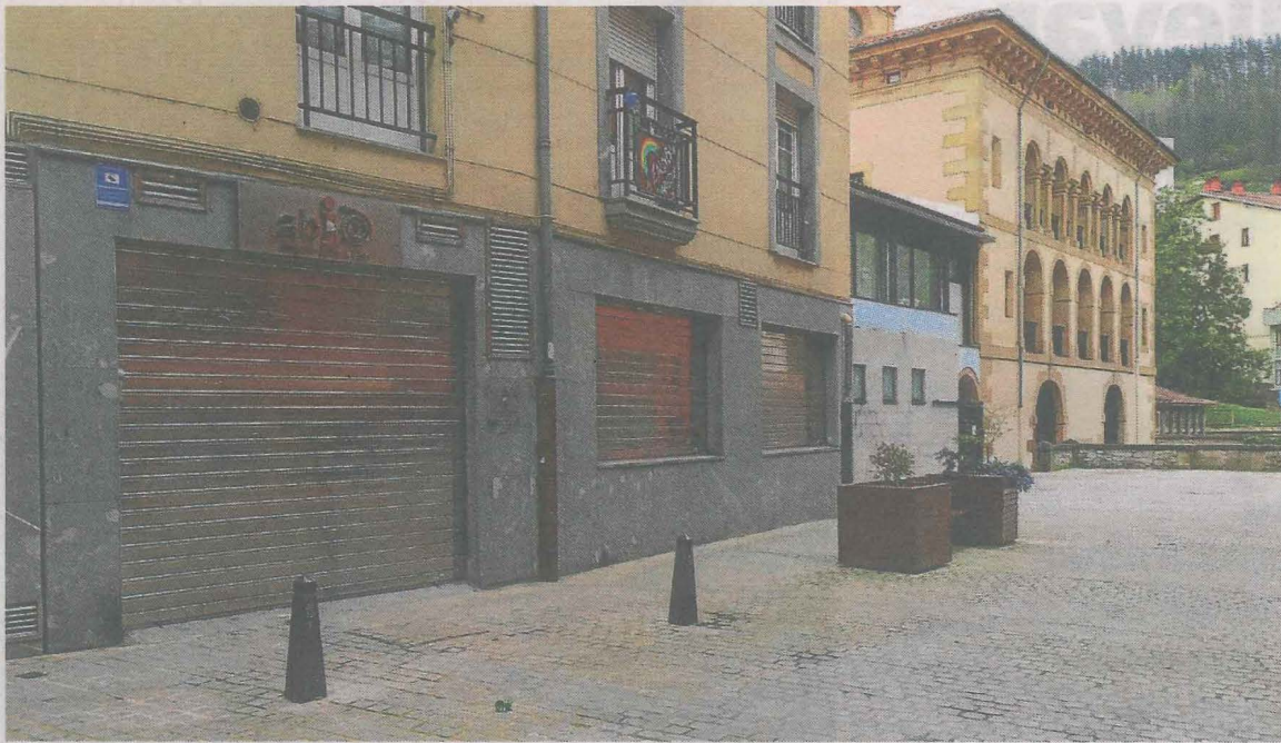
Las oficinas de Abiapuntu permanecen cerradas desde mediados de marzo. AINHOA LASUEN

De hecho, al objeto de que las familias de Ermua que, por las situaciones de pérdida de empleo, precisen solicitar la RGI o la Prestación Complementaria de Vivienda (PCV) y carezcan de medios para tramitar estas prestaciones a través de la web, el Ayuntamiento se ha ofrecido como entidad colaboradora y facilitadora.