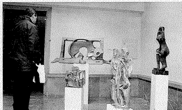
Un visitante observa las esculturas del artista de Elgoibar.