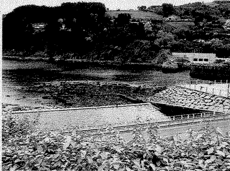
Los socorristas se encargarán de vigilar la piscina de agua de mar.

Kurtso amaiera hurbiltzen ari da eta horrekin batera Kirol Eskolako programazioa ere laburtzen doa. Bihar larunbata programazio polita eramango dute aurrera monitorea. Eguerdiko 12:00etan Mutriku Kiroldegian bildu eta benjamin mutilen Kristozulo, Hondarbeltz eta Atxukale eta benjamin nesken Alkolea bildu, lau talde atara eta kanpo osatu ondoren areto futboleko bi partida jokatu dira une berean eta ondoren finala eta hirugarren eta laugarren postua erabakiko dutena. Beraz txapelketa polita ikus ahal izango dena.