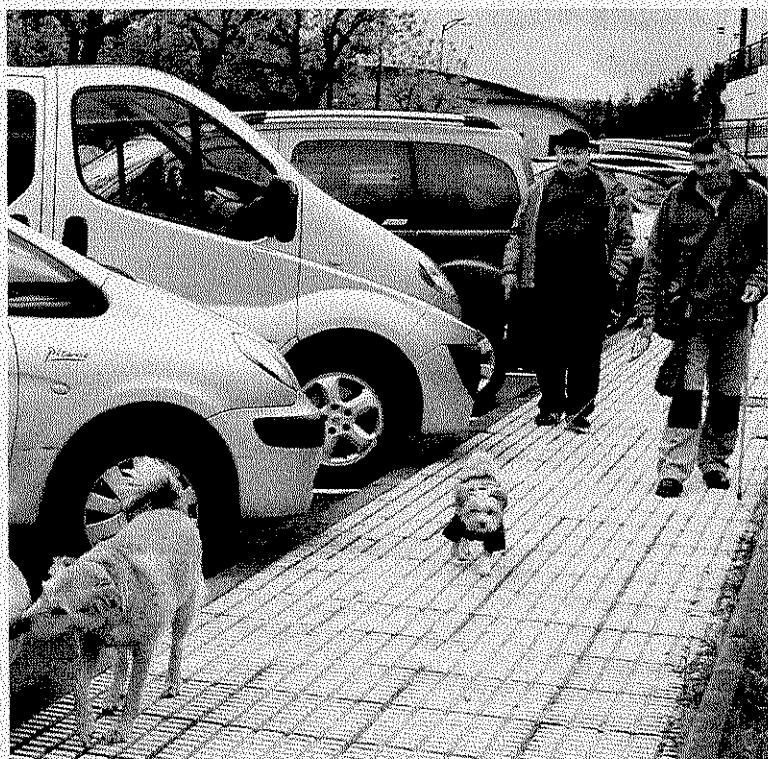
La nueva ordenanza regulará la protección de animales.

Cabe destacar también que quedan fuera de esta ordenanza las actividades o actos en los cuales intervengan animales y que están regulados por una normativa específica como la caza, la pesca, los toros, etc.