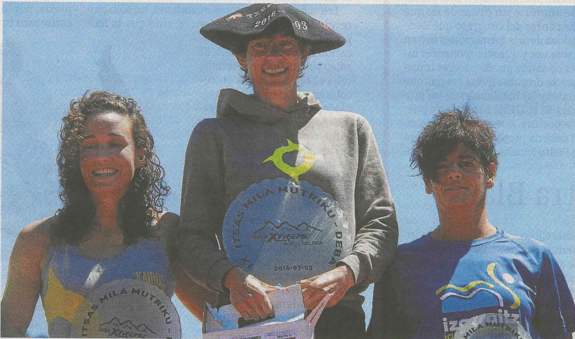
Podios finales en las categorías masculina y femenina.