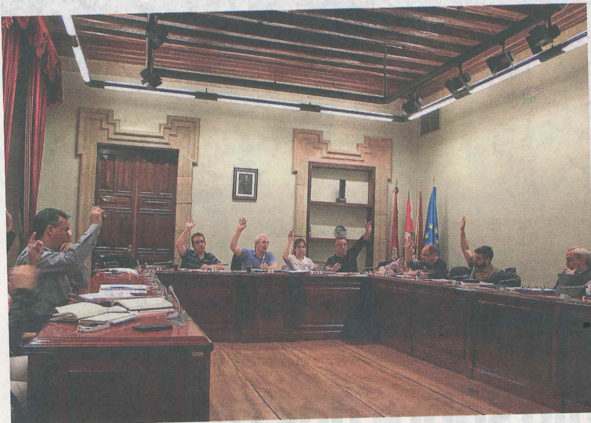
El pleno municipal aprobó por unanimidad la propuesta. ■ A. LASUEN.

El convenio apunta a que «el objetivo de Mallabia es mejorar la calidad de vida de la ciudadanía y satisfacer cualquier tipo de necesidad o interés de la comunidad».