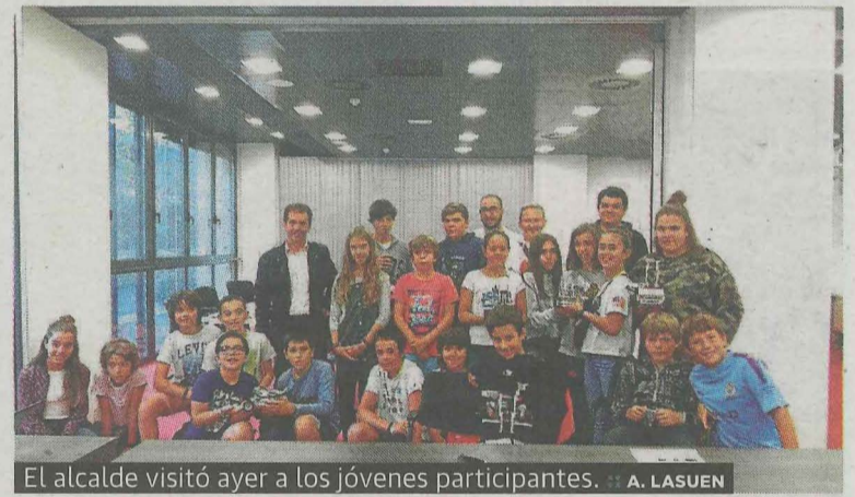
El alcalde visitó ayer a los jóvenes participantes.

dáctico, cuyo pilar fundamental es la diversión, intercalado con las competencias que engloba el acrónimo anglófono STEAM (ciencia, tecnología, ingeniería, artes y matemáticas) de forma lúdica, para promover y fomentar promoverán la creatividad y la innovación mediante experimentos sencillos y divertidos. La juventud participante tendrá la oportunidad de presentar sus trabajos el próximo día 28 de septiembre en Elgoibar, en el encuentro de Gazterobotika en Debabarrena.