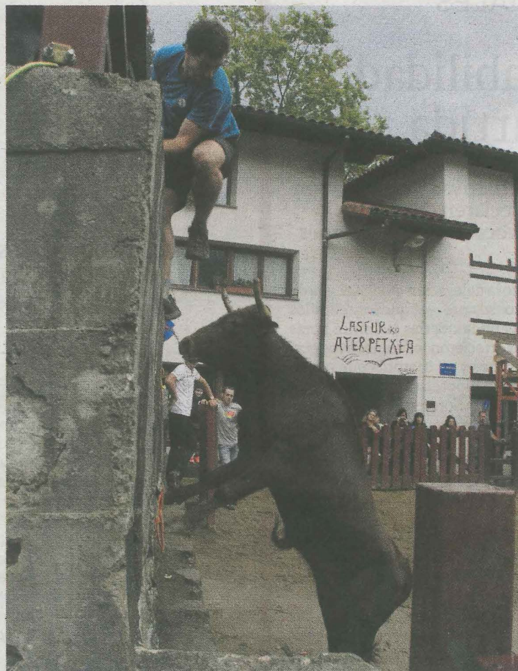
Las vaquillas en las fiestas de Lastur tienen gran protagonismo.

El próximo viernes 13 se ha organizado una cena con bertsolaris en el bar y el sábado 16 celebrarán el día de las parejas con los juegos como protagonistas. El último día de fiestas, el domingo 17, el deporte rural será el protagonista.