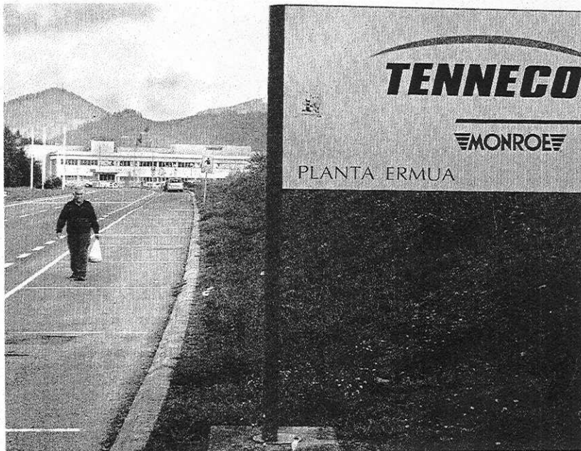
TENNECO. Acceso a la planta de la empresa de automoción en el Alto de Aretio.

Será en 2008 cuando las instalaciones de AIC-Automotive Intelligence Center podrán ser utilizadas por las distintas empresas