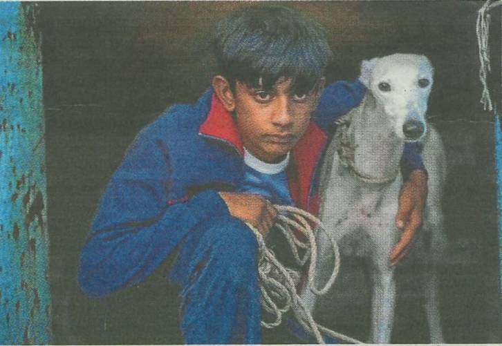
La premiada 'Ciudad sin sueño' se proyecta hoy a las 20.30 horas AYTO.

Desde la plataforma hacen así un llamamiento a la movilización ciudadana para posicionarse en defensa de la autodeterminación venezolana y a participar activamente en el acto de mañana, reafirmando su compromiso con la solidaridad internacionalista frente a lo que consideran una deriva autoritaria de la política exterior estadounidense.