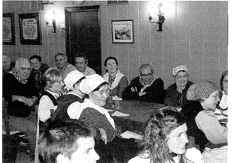
Santa Eskean ibili ziren lagunak elkartean. :: LAZKANO

Baserri denak bisitatu ondoren kalera jaitzi ziren eta bertan, parean jartzen zen edonori kopla xelebreak abestuz aritu ziren, giro oso alaietan. Arratsaldeko 3rak aldean bukatu zuten lanarekin eta ondoren denak Aizpe gastronomi elkartearen batu ziren bazkari eder bat dastatzeko eta diru kontakete-