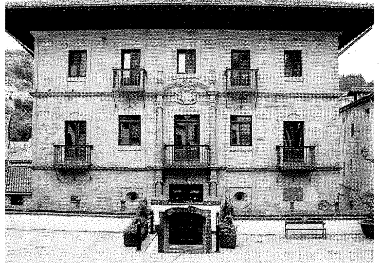
La reunión abierta se celebrará en el palacio Zabel.

El plan de gestión que marcó la Diputación recoge un total de siete objetivos entre los que se recogen la mejora de infraestructuras de movilidad y comunicación, establecer el equilibrio territorial, proteger el medio ambiente, incidir en la profundización de la identidad, avanzar en bienestar social y solidaridad, potenciar el desarrollo y la