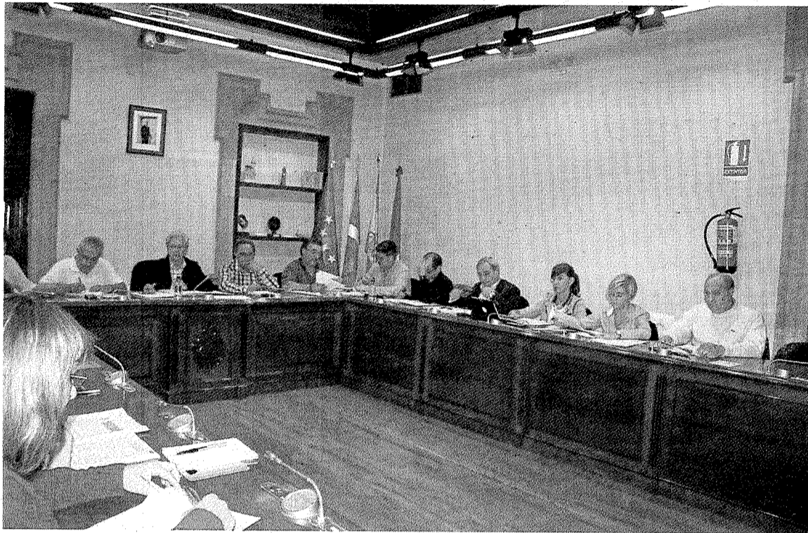
Parte de los componentes del equipo de gobierno PSE-PP en el pleno municipal.

También se pretende mantener su carácter progresivo, es decir, un mínimo común a un precio y el exceso por encima de esa cifra a un precio más alto. La moción pretende también reconocer que «las circunstancias económicas deben hacernos más sensibles, sobre todo con quie-