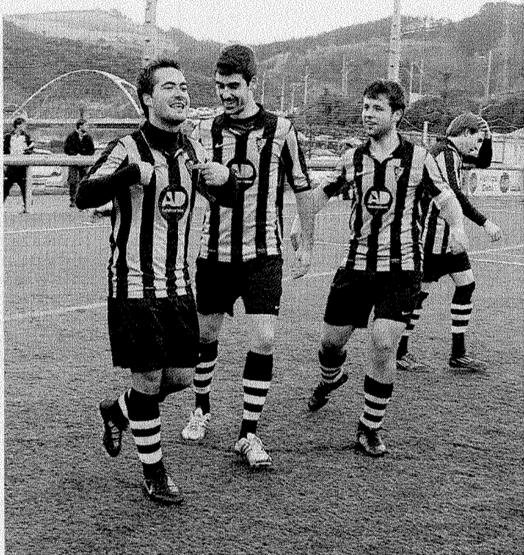
El Amaikak de Preferente fue muy superior al Mondragón. :: SALEGI

El cadete femenino se hizo con el triunfo en su visita al campo del Urnieta. En un choque muy dispu-