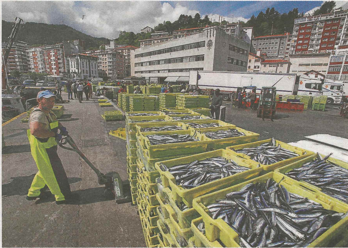
En el puerto de Ondarroa se sigue descargando anchoa.

Unicamente, cuentan con cuotas los barcos de artes menores que