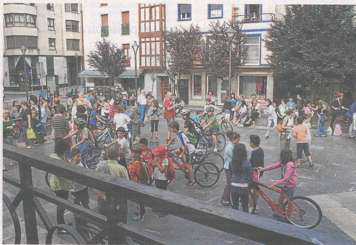
Actividad del Día de la Bicicleta celebrada en las colonias infantiles de Ermua.

En la actualidad ya se ejecutan en Marqués de Valdespina y Probaleku diferentes medidas de reducción de velocidad del tráfico. Se denominan zonas de coexistencia del tráfico rodado y peatonal y permiten dar preferencia a los peatones frente a los vehículos en zonas céntricas del municipio que se podrán utilizar para pasear, puesto que los vehículos deberán cumplir las normas de tráfico lento que se establecerán una vez concluidas las obras de asfaltado.