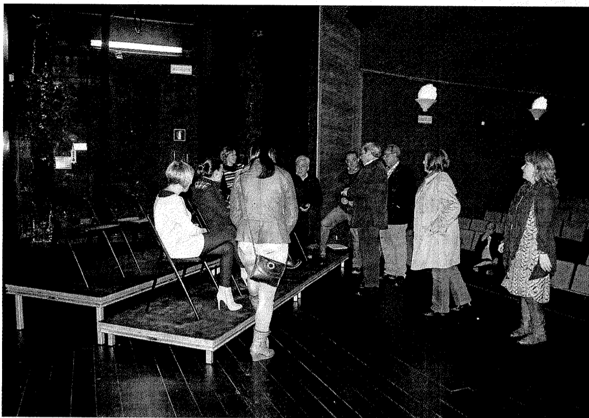
Visita de la corporación al lugar donde hoy se desarrollará la presentación del presupuesto. ■ A. LASUEN