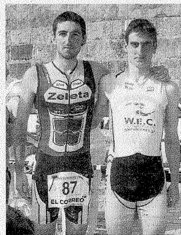
Egaña y Aristi. ■ ANDER SALEGI

La temporada llega este sábado a Deba. Las características de la prueba serán similares a las de Bermeo.