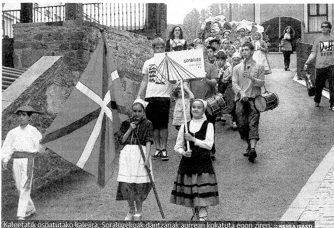
Kaleetatik ospatutako kalejira, Sorluzekoak dantzariak aurrean kokatuta egon ziren. NEREA ISASTI