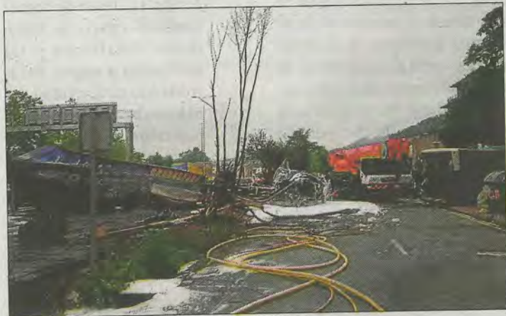
Estado en que quedaron los vehículos implicados. SOS DEIAK

A las 22.00 continuaban las labores de limpieza de la vía y de retirada de los vehículos implicados en el aparatoso accidente.