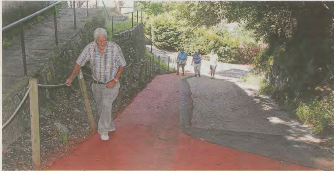
Caminantes por la senda acondicionada para reducir el riesgo de accidentes.