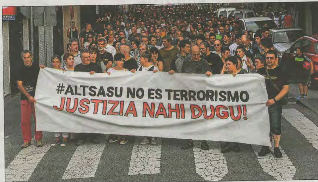
Imagen de la manifestación de ayer en Altsasu.

Las madres y los padres de los jóvenes procesados por la trifulca de Altsasu han recogido ya cerca de 60.000 firmas, tres veces más de las que tenían la semana pasada, antes de conocer la calificación fiscal.