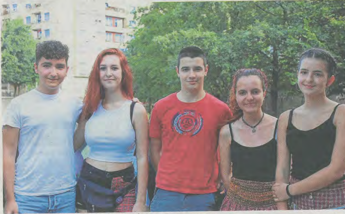
Participantes en el nuevo colectivo surgido en Ermua.

—Sobre el machismo, del sistema educativo, la educación actual, el capitalismo, básicamente sobre movimientos sociales, sobre el bulling, sobre todas las asesinadas por vio-