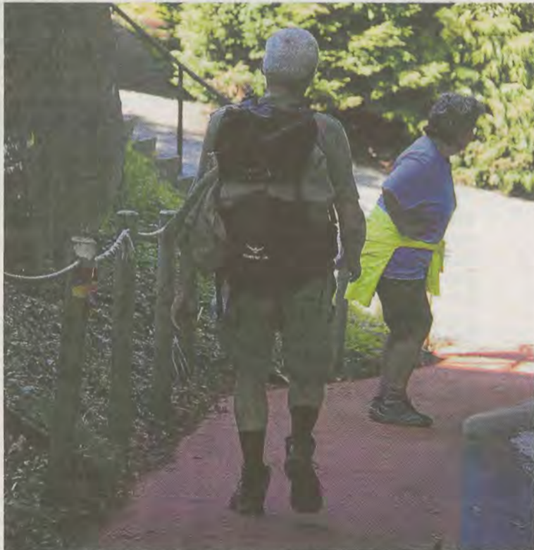
La lámina rojiza indica por dónde es más conveniente caminar.

Según declaran desde la Asociación «en la bajada final hacia Deba se producen frecuentes caídas de caminantes sobre todo en días de lluvia debido a que el pavimento se encuentra muy desgastado y pulido». Para reducir el riesgo de accidentes se ha instalado una capa de asfalto antideslizante de un metro de anchura en uno de los lados del camino, que ha sido recubierta con una lámina de resina de color rojiza cuya finalidad es identificar claramente por donde es conveniente que camine el peatón. La obra se ha realizado entre el depósito de aguas de Agirretxe y la ermita de San Roque, en una longitud de 220 metros. Esta banda antideslizante no será exclusiva para las personas, pues la poca anchura del camino obliga que los automóviles la puedan pisar cuando tengan que