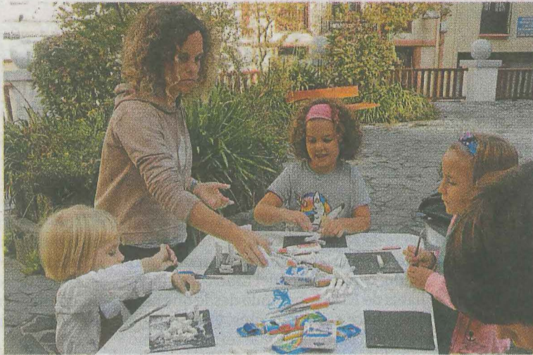
Un momento del taller de tizas.