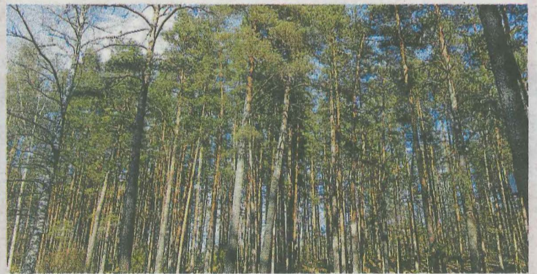
Zuhaitzak ederra Debako inguruetan. :: SALEGI

Parte hartu nahi dutenek aurrez izena eman beharko dute labor.eus/zuhaitzak2019 formula-