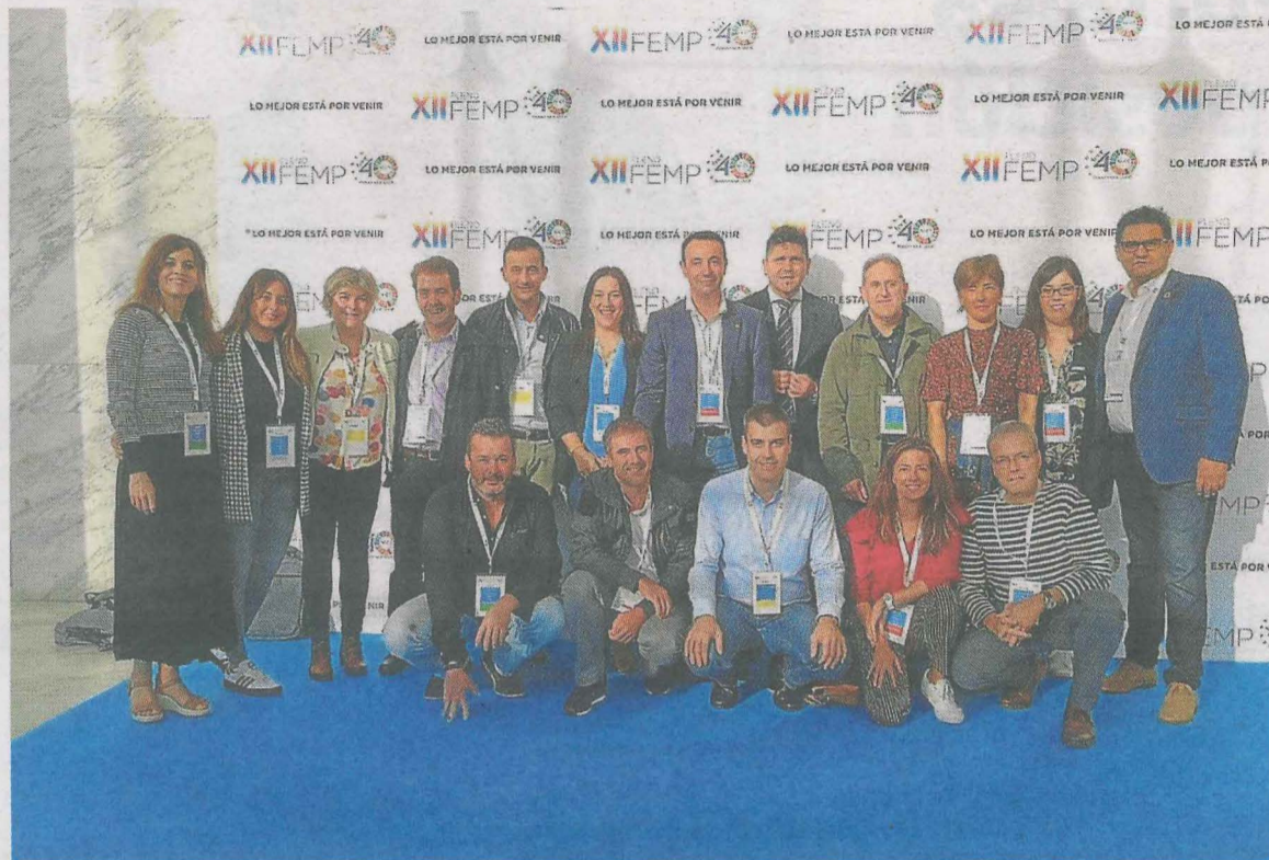
El alcalde de Ermua (cuarto por la izquierda) junto a otros representantes municipales.

Los municipios que se han adherido a esta declaración reconocen además que «su logro dependerá de la capacidad de hacer realidad los 17 obje-