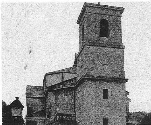
Vista de la parroquia neoclásica de Mutriku.