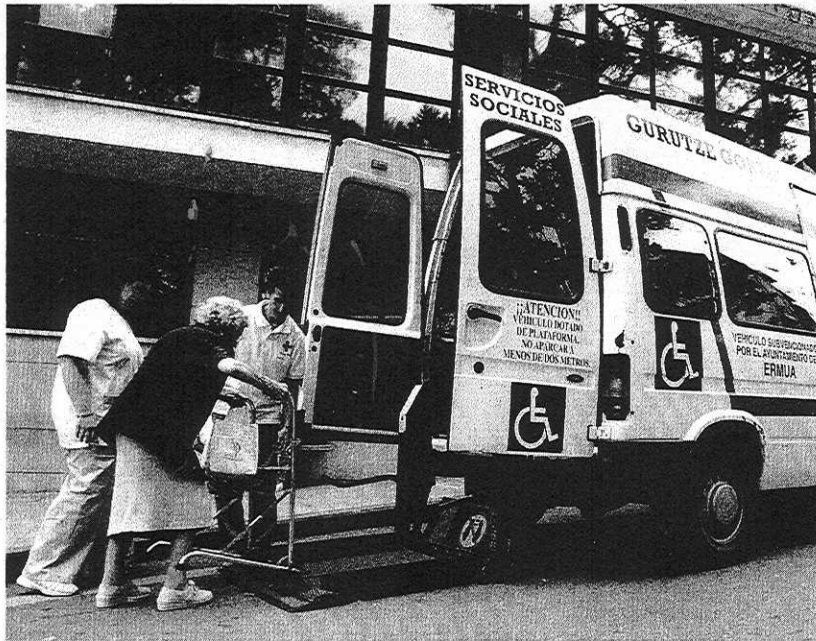
APOYO. Una ermuarra es transportada en furgoneta al centro de día.

departamento de Acción Social en relación a las personas dependientes, este mes se volverá a repetir una actividad formativa que lleva desarrollándose desde hace 4 años en Ermua, dirigida a 20 cuidadoras de personas dependientes.