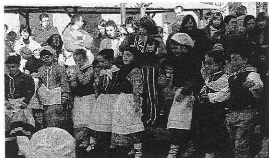
Gaztetxoak baserriarraz jantzita azoka egunean. [EGAÑA]

Arratsaldeko jaialdia San Agustín Kulturunean izango da arratsaldeko 18:00 etan Arriola Aizpakantuan eta Azkoitiko Xirrika dantza taldea. ■