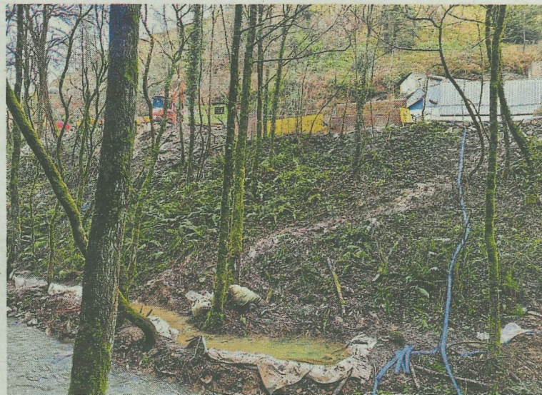
Las labores se localizan ahora entre Hierros Bilbao y Abelleira.

El impacto medioambiental de esta actuación será inmediato. Una vez operativos los nuevos colectores, todos los vertidos de aguas residuales de Ermua y Mallabia que hasta ahora acababan