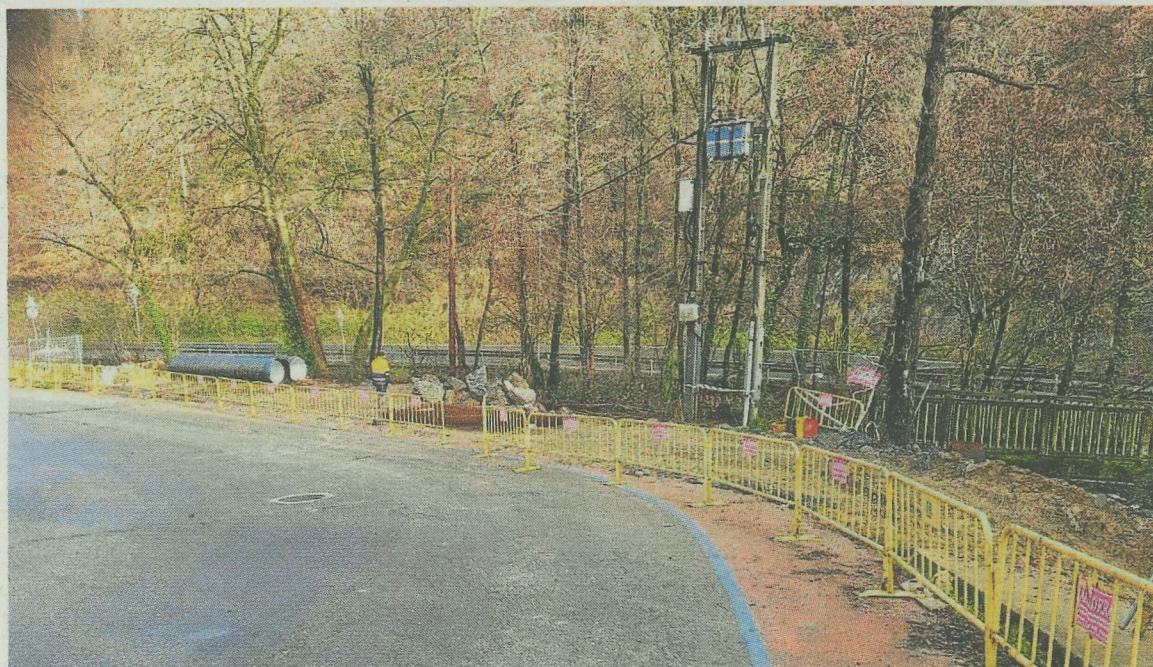
Las obras ocupan una zona amplia, acotada para permitir el paso de peatones en el sendero a Goitondo. A. L.