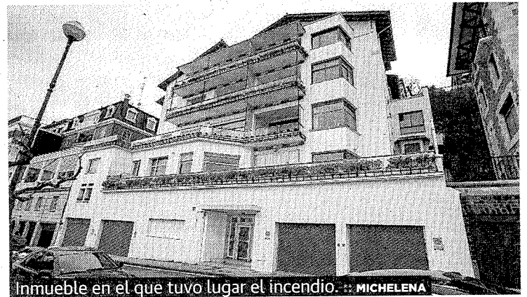
Inmueble en el que tuvo lugar el incendio.