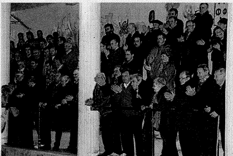
Probalekua ikusleaz bete zen azkeneko saioan.

ren 47 plaza, 3 zinta eta 3,94 metroak ez zen nahikoa izan hori lortzeko eta laugarrenak izan ziren. Eloorrioko Arienza bosgarrena izan zen, bere pareak 46 plaza eta 3,18 metro egin eta gero. Billelako Laskik seigarren postua eskuratu zuen, bere animaliek 45 plaza, 1 zinta eta 1,45 metro egin ondoren.