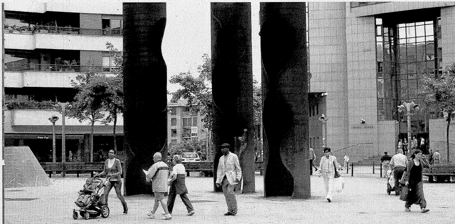
Varias personas caminan por la céntrica plaza Bide Onera de Barakaldo.

● Presupuesto 2014. El Ayuntamiento de Barakaldo ha destinado en el borrador de presupuestos una partida de 550.000 euros, aunque puede aumentarlo o disminuirlo en función de las necesidades.