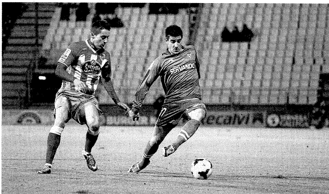
El lateral guipuzcoano es el jugador de campo que más minutos acumula en lo que va de temporada.

Más fresca aún en la memoria está la gesta obtenida en la temporada 98-99. Acudió al rescate de un Eibar casi desahuciado y tras sumar 21 puntos en las últimas nueve jornadas firmó una salvación que figura como una de las remontadas más destacadas de la historia de la categoría de plata.