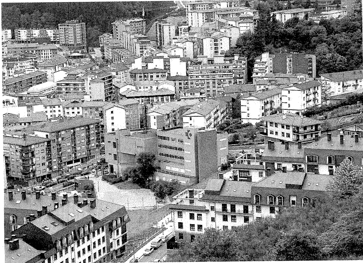
La población ermuarra reside en siete zonas o barrios. ■ A. LASUEN

Uno de los cambios más importantes en los últimos años es la incorporación de la zona de San Pelayo al segundo lugar de los espacios con más residentes. En este perímetro en el que se incluyen las calles Aldapa, ca-