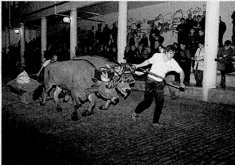
Guztira, 19 parte-hartzaile izan ditu lehiaketak. :: ANDER SALEGI

Lan polita egin zuten Aiako Patxi Artzadunek idiek. Hirugarren postutik gertu gelditu ziren, baina eu-