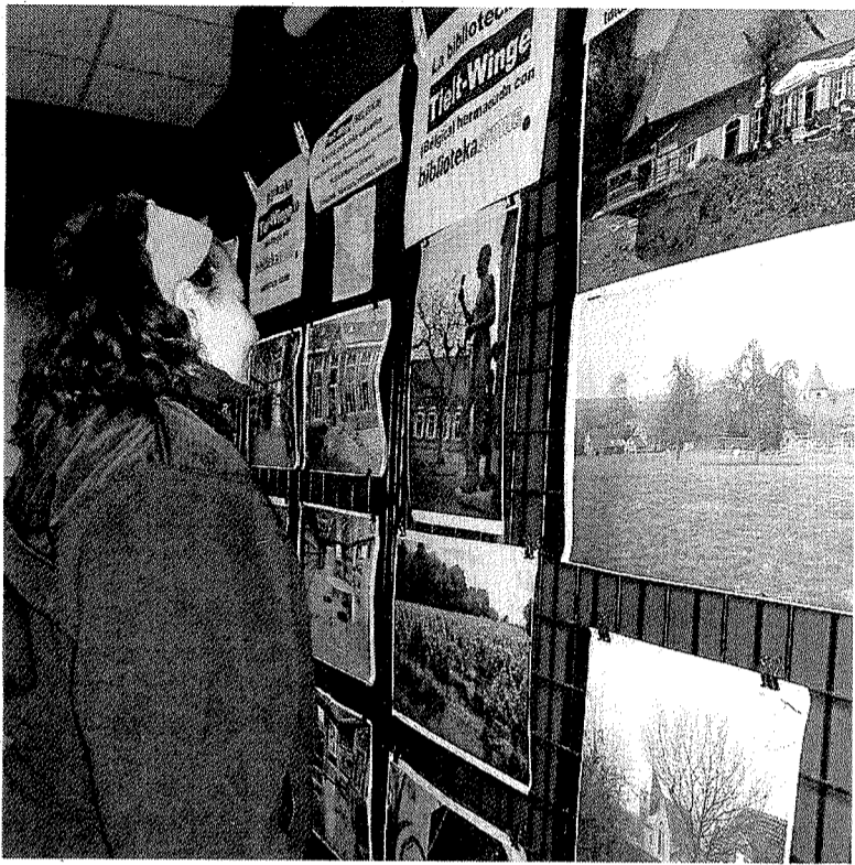
Una chica mira la exposición de Tielt-Winge en Ermua.

La biblioteca ermuarra ofrece una muestra fotográfica del municipio belga