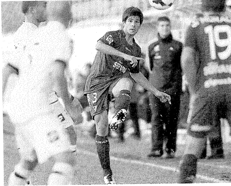
Kijera volverá a la titularidad mañana en Córdoba.

El de Derio recuerda que «desde el principio el objetivo del Córdoba es subir a Primera. Han hecho mu-