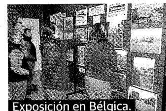
Exposición en Bélgica.