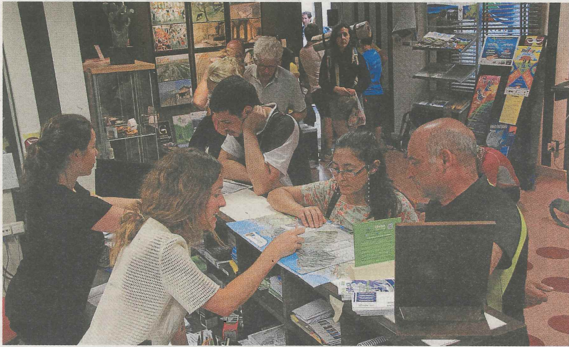
Herriko turismo bulegoa, gainezka. :: SALEGI