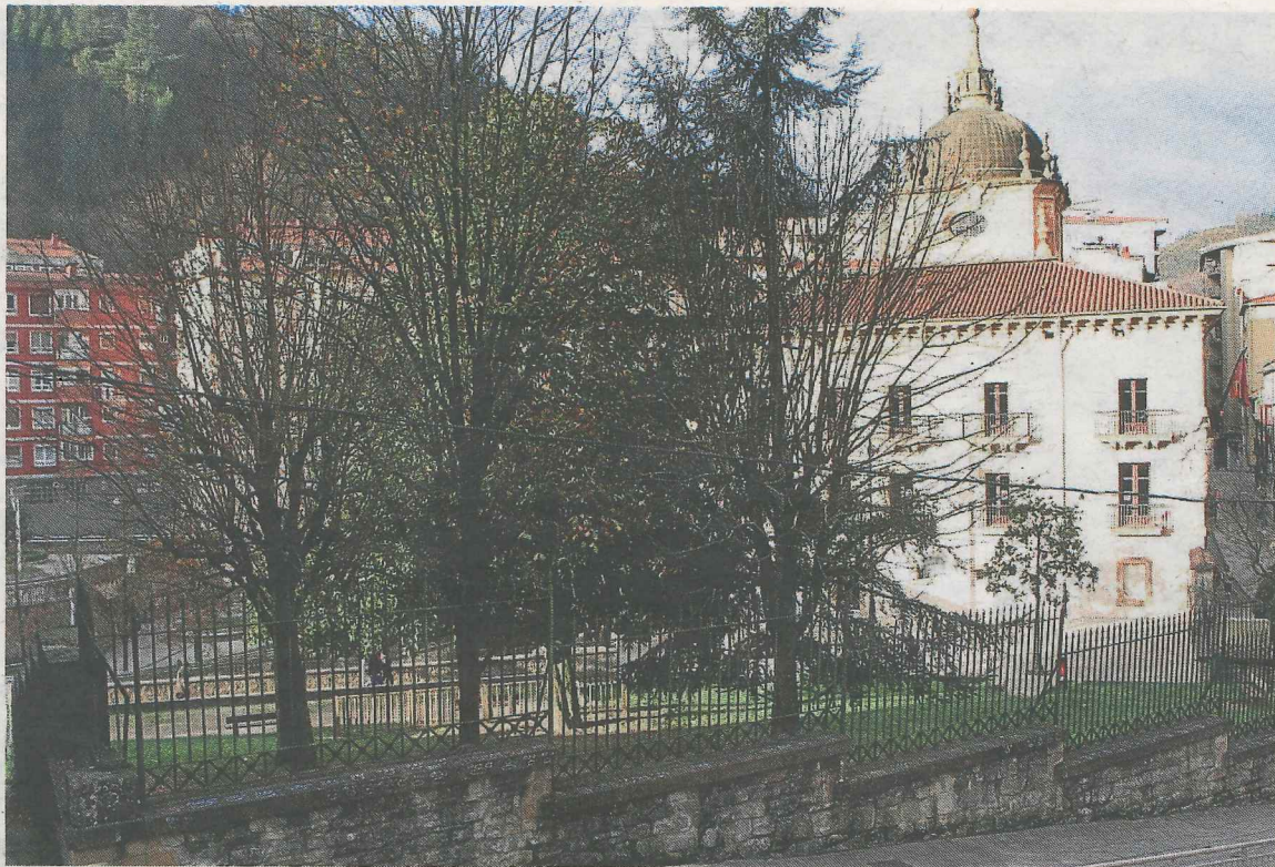
Zona del parque Marqués de Valdespina donde se pueden dejar los perros sueltos.