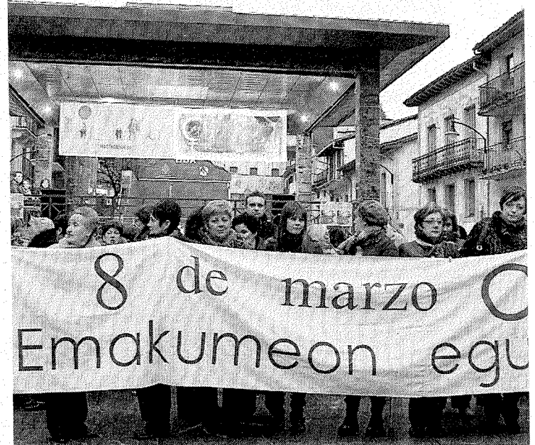
Concentración celebrada el 'Día de la Mujer' en Ermua. ■ A. L.

Además quiso recalcar que su grupo sí presentó esta propuesta en los presupuestos forales, debatidos en diciembre de 2009.