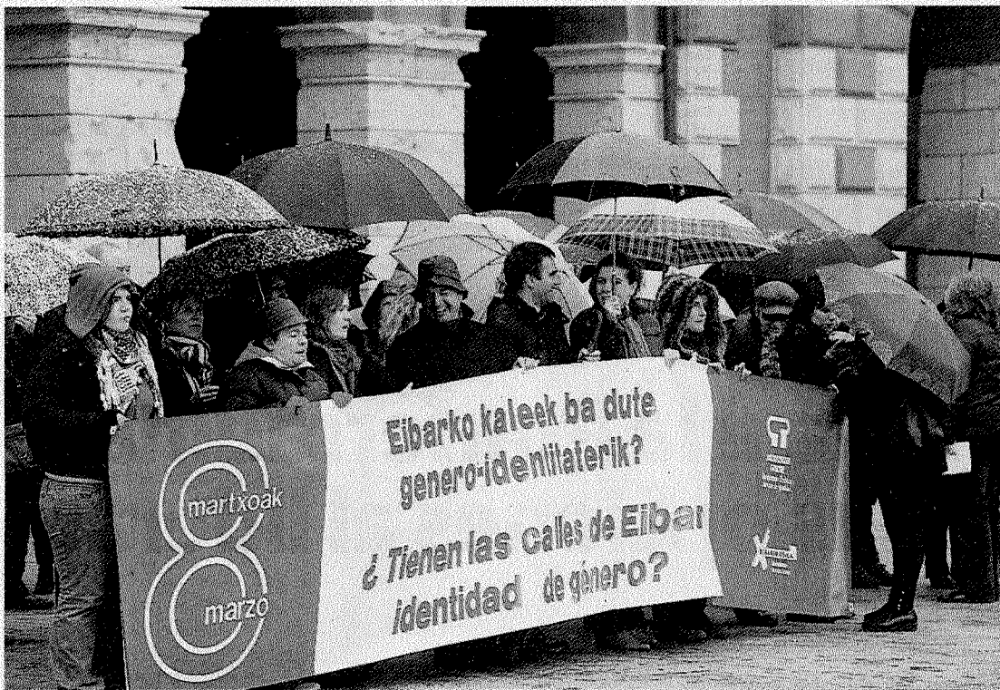
Los paraguas protegieron a las personas que participaron en la concentración.

Un vecino se queja de la falta de limpieza en una zona de Legarre alto, en los números 8 y 14. «El alumbrado y las vallas son mantenidas por el Ayuntamiento y en los asuntos de limpieza se nos indica a los vecinos que no van a llevar a cabo la retirada de residuos y adecentamiento de unas zonas por tener un carácter particular. No entiendo esto. Se ha pedido varias veces al Ayuntamiento y