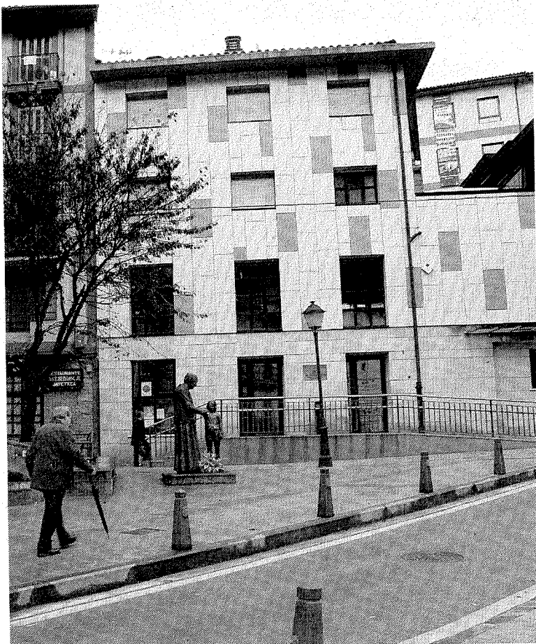
Edificio municipal del área de Servicios Sociales. ■ A. L.

Tras la actuación, los colectivos organizadores aseguraron que «la precariedad sigue teniendo rostro de mujer», por lo que solicitaban que «las políticas de combate de la crisis incorporen actuaciones específicas contra las desigualdades». Por último, desde el quiosco de Cardenal Orbe, los colectivos organizadores quisieron recordar la cita de este jueves, a las 11 horas, para recibir a la Marcha Mundial de las Mujeres.