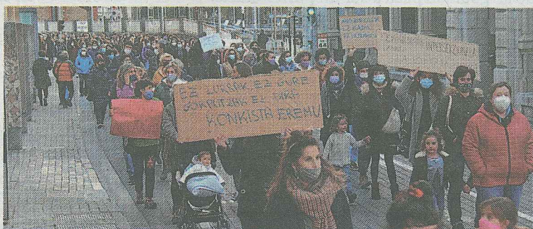
Hainbat herritar atera ziren kalera emakumeen eskubideak aldarrikatzeko.

Baina emakumeen borroken garaia ez da amaitu. Mundu osoan eta gure tokiko komunitateetan oraindik ere emakumeenganako bereizkeriak eta ezberdintasunak daude, emakume izate hutsagatik. Hau guztiari bizi dugun krisi sistemikoan gehitu behar zaio, beste krisi batzuekin gurutzatu eta erlazioz dena; esaterako, ekologikoa eta zaintza-arlokoa. Pandemiak agerian utzi ditu mugimendu feminista eta emakumeen kolektiboak egiten ari ziren zenbait aldarrikapen. Ezerk ez du garrantzia handiagoa izan behar bizitza zaintzek baino, pandemia dela-eta muturreraino prekarior