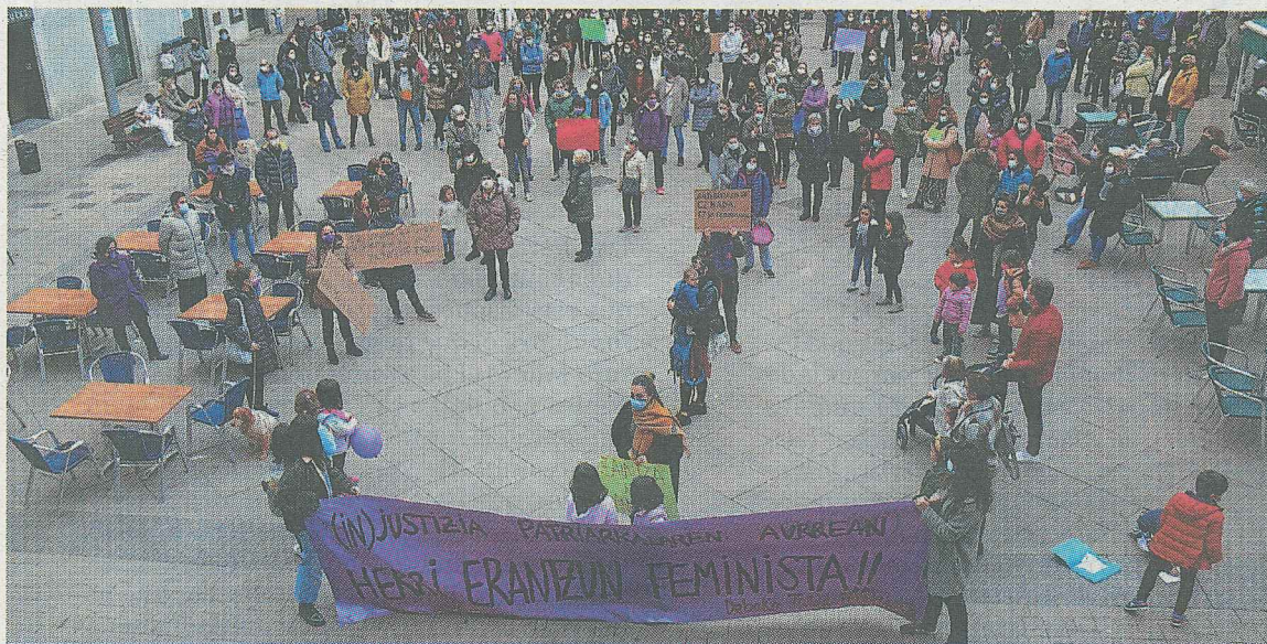
Udaletxeko plazan eman zitzaion amaiera atzoko manifestazioari. A. SALEGI