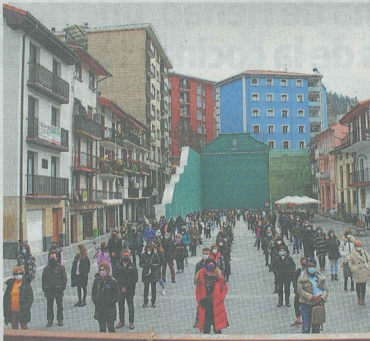
A las 13.00 horas, cerca de 150 personas se concentraron en la plaza. A.L.

Esta manifestación, que transitó por el centro de Ermua, tras una pancarta con el lema 'Dena aldatu, sistema arrakalatu' ('Cambiamos todo, agrietemos el sistema'), abogaba por «tomar las calles para que sigan siendo un espacio de denuncia». Las feministas de Ermua abogaban por «resquebrajar el sistema capitalista, heteropatriarcal, racista y colonial, para lo que debemos organizarnos en el feminismo y seguir luchando colectivamente». De hecho, apostaban por «tejer alianzas y abrir espacios de lucha para cambiarlo todo».