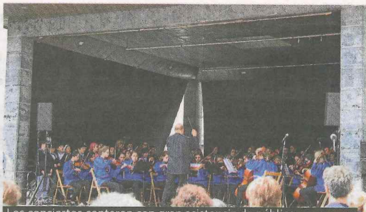
Los conciertos contaron con gran asistencia de público.

Suiza, Eslovaquia, Hungría, Austria y las voces anfitrionas de la Escuela de Música local, Alboka y la coral Pispillu, que hicieron disfrutar de lo lindo con música y cantos a los presentes. La actividad estaba organizada por la Asociación Europea de Escuelas de Música (EMU) en un proyecto de 'San Sebastián 2016, Capital Europea de la Cultura'. Los conciertos concluyeron con la suma de todos los músicos y el alumnado de la Escuela de Música local interpretando el tema 'Musikatu bizitza'.