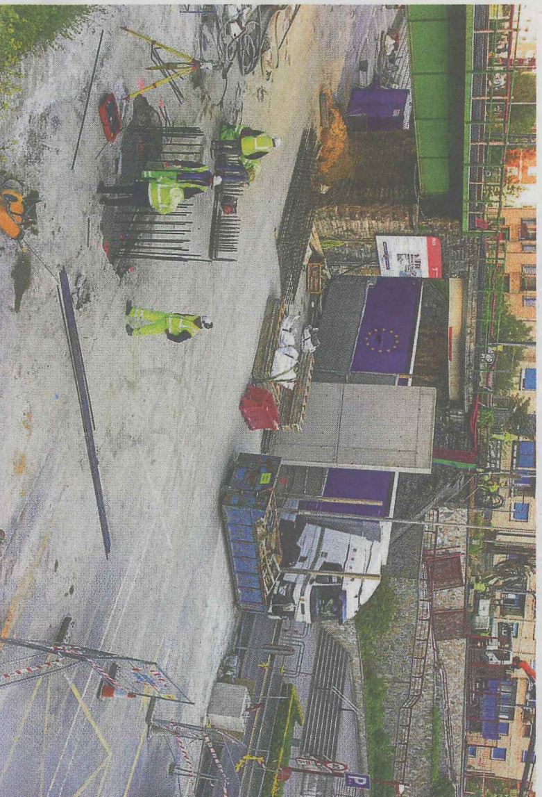
Los operarios trabajan ya en las labores de preparación de la nueva infraestructura.

Para la habilitación de estas plazas provisionales, es preciso modificar la situación de los contenedores, que se trasladan a un espacio cercano a la panadería San Antonio, en la misma calle Izelaieta. A ello se suman otras plazas provisionales más en las inmediaciones del barrio (Avenida de Bizkaia, Lomi-Power) con la intención de reducir la afectación y paliar el impacto de desalojar el aparcamiento. Está previsto que esta infraestructura pueda volver a estar operativa para el mes de agosto.