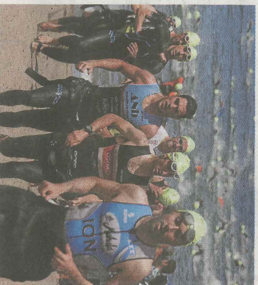
Algunos triatletas saliendo del agua.