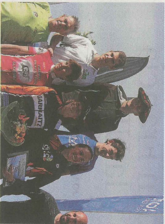
Podio masculino y femenino.