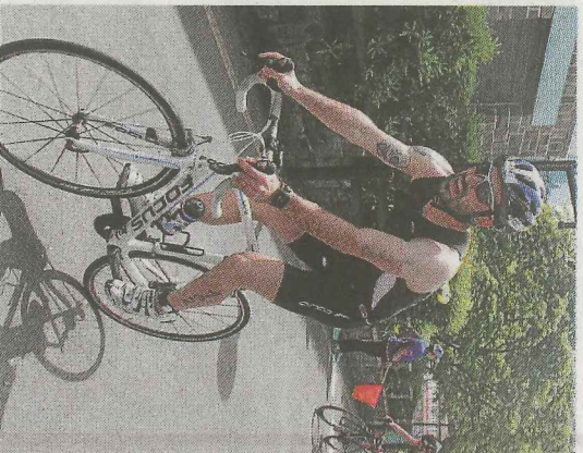
Momento ciclista de la prueba.