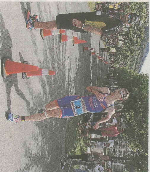
Los participantes tuvieron que correr 5,2 kilómetros.