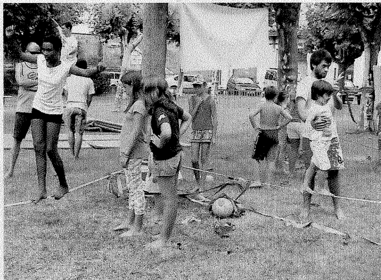
Los cursos de flow balance se dieron en la Alameda.

10.00-14.00: Cursos gratuitos de stand up 12.00: Carrera de stand up 12.00-19.00: Canoa hawaiana 16.30-19.30: Cursos gratuitos de surf y skate 20.00: Fiesta en la carpa 23.00: Música de Trasteando Band + Mamba Beat + DJ