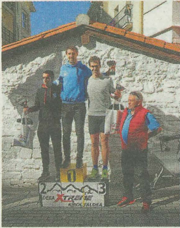
Podio masculino.