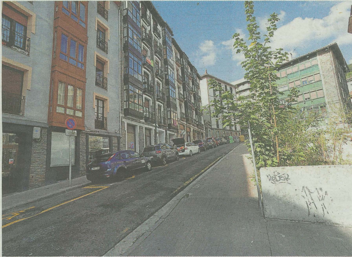
La calle Bittor Sarasketa quedará cerrada desde los juzgados hasta la Estación. MIKEL ASKASIBAR

De este modo, los vehículos que procedentes desde la zona de Urkizu accedan a Bittor Sarasketa, a la altura del número 12 (frente a los antiguos juzgados), deberán continuar hacia Matxaria por el túnel, y desde ahí regresar a Estaziño por Ibargain y Pagaegi; o bien tomar la variante en Matxaria para seguir hacia el centro de Eibar.