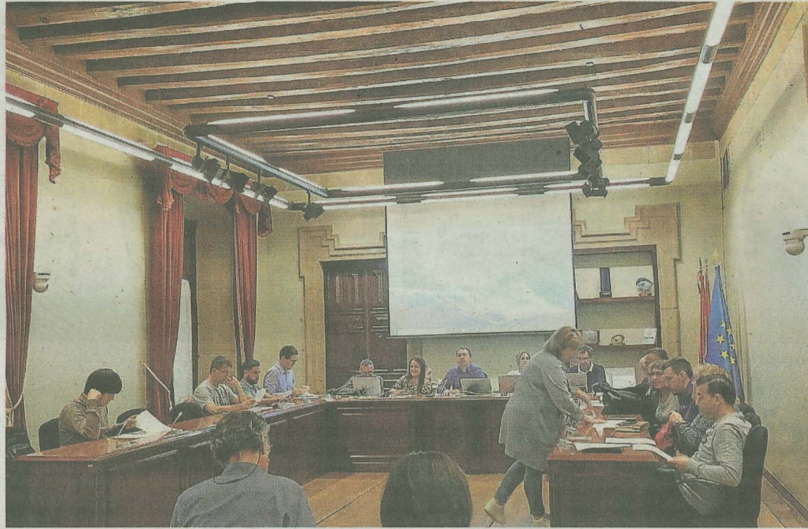
La corporación debatirá la aprobación de las enmiendas y la propuesta municipal en un próximo pleno. A.L.

La propuesta municipal para 2023 también incluye una modificación en la tasa de los servicios del cementerio local «para poder adaptarse a los cambios en los gastos del precio de la energía, que también han afectado a este servicio», explicaban desde el equipo de gobierno en la presentación de su propuesta.