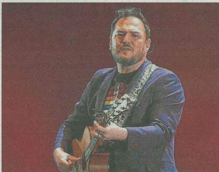
Ismael Serrano actuará el próximo día 27 en Ermua.

madre soltera de dos gemelas que vive la vida alimentada tan solo por el aire que respira y, quizá, por la positividad y la sonrisa que nunca pierde ante tanta amargura. Pero de pronto todo cambia y, de la noche a la mañana, se convierte sin quererlo en una heroína. Los medios de comunicación hacen de ella la persona más popular del momento y políticos, periodistas y programas de televisión se la disputan”, reza la sinopsis.