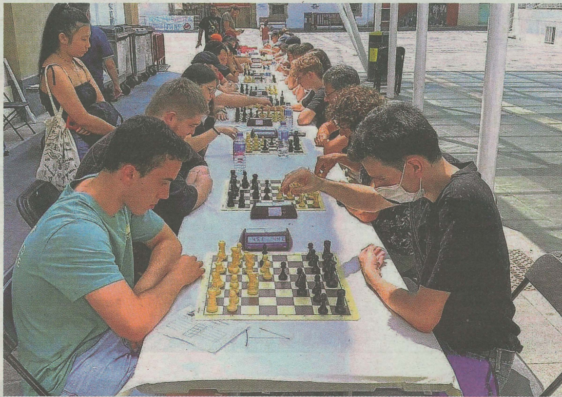
Las actividades organizadas por colectivos en las fiestas patronales se subvencionan con estas ayudas. E.C.

Otra de las subvenciones culturales para las que se establecen más ayudas en este campo trata de impulsar el asociacionismo a nivel local y elaborar un programa de actividades culturales que responda a los intereses e inquietudes de la ciudadanía. Los 54.500 euros que se destinan a esta materia se reparten entre las asociaciones y colectivos, sin